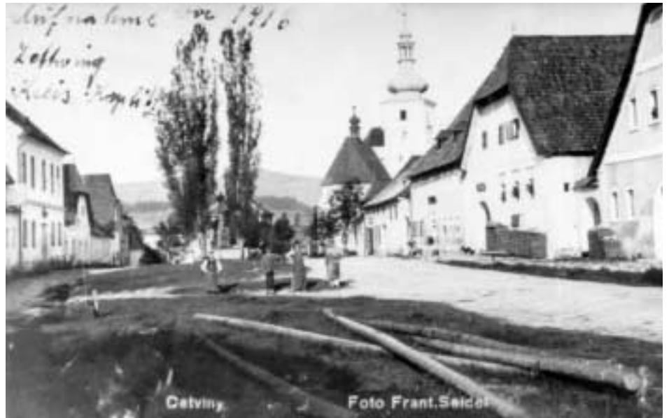
Alte Ansicht von Zettwing

Bis etwa zur Mitte der 1950er Jahre war die Grenzbewachung auf tschechischer Seite noch relativ locker. So badeten etwa in der Malsch tschechische