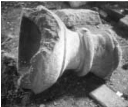
Ansichten aus dem Kircheninneren, vor der Restaurierung