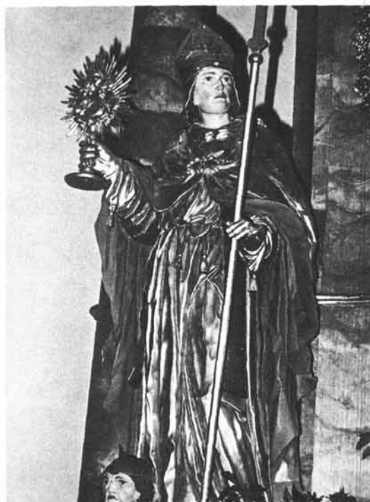
Abb. 3: Hl. Norbert, Statue am Hochaltar der Pfarrkirche Schwarzenberg, 1912 gefertigt.

Zu: F. Haudum, Jordan Koller