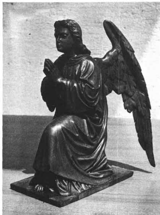
Abb. 2: Engelfigur aus Lindenholz von J. Koller; Privatbesitz.