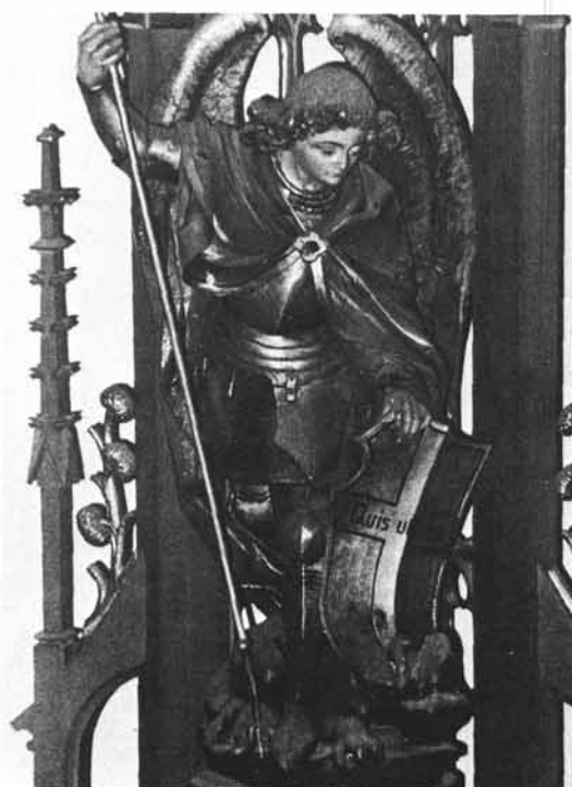
Abb. 4: Hl. Michael, bekrönende Figur des linken Seitenaltars der Pfarrkirche Ottensheim (1914).

Zu: F. Haudum, Jordan Koller