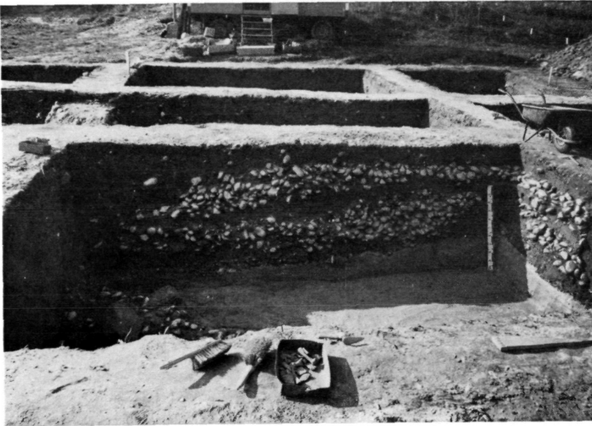
Abb. 11: Gusen/Berglitzl; Bronzezeit, Teilprofil der Steinpackungen des Opferplatzes am Fuße des Osthanges (Quadrant XI f/72; – Foto: M. Pertlwieser).