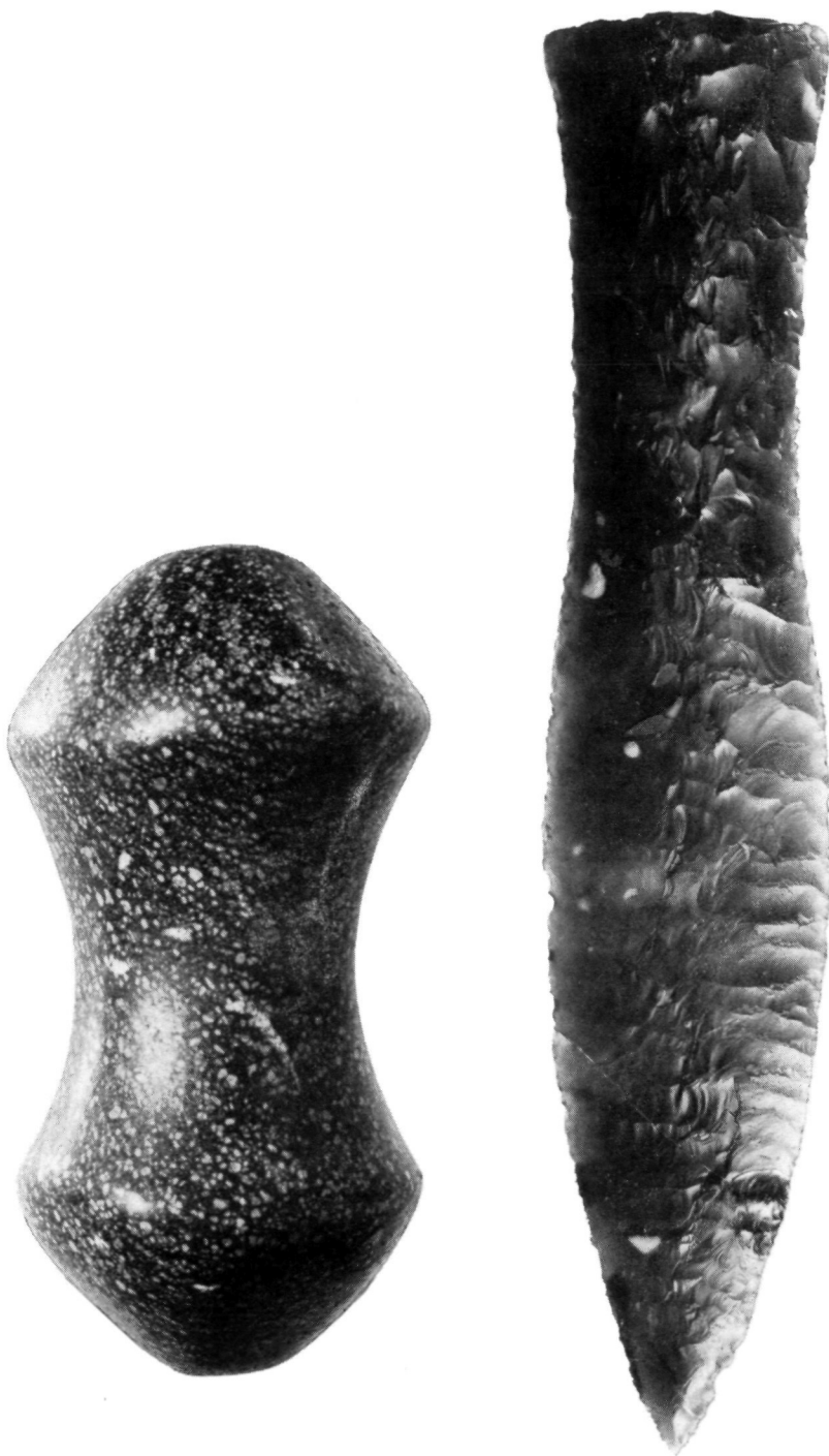
Gusen/Berglitzl; Bronzezeit, Opfergegenstände aus Kultobjekten: Abb. 12: Grünsteinspule (L = 43 mm) aus Objekt XXVIII/69. – Abb. 13: Feuersteindolch aus Objekt LI/72 (L = 21,7 cm) (Foto: Max Eiersebner).