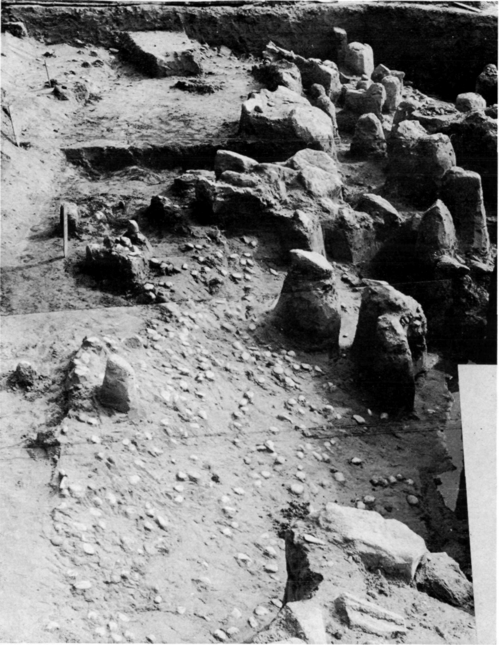
Abb. 6: Gusen/Berglitzl; Neolithikum, das tiefe schräge Rundsteinpflaster, darüber angelandete Sedimentschichten und Teile der Überbauung durch Felsplatten (nächste Handlungsperiode); „Uferzone“ am südöstlichen Hangfuß (Foto: M. Pertlwieser).