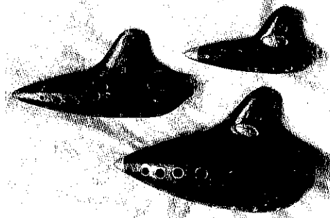
Okarinen aus Wien (um 1900)

Bemerkenswerterweise wurde die Okarina zur damaligen Zeit jedoch hauptsächlich in städtisch-bürgerlichen Kreisen gespielt und war am Land so gut wie nicht zu finden.