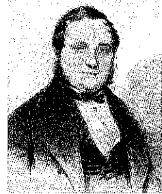
Adalbert Stifter. Aquarell- Miniatur von Moritz Michael Daffinger (1846).