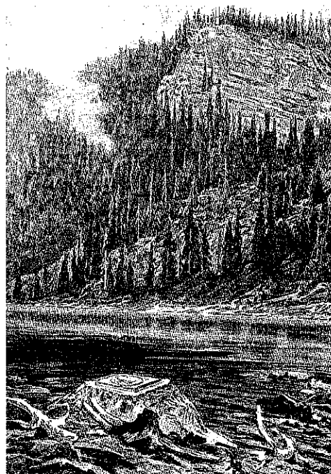
Plöckensteinersee, Kronprinzenstein und Stifterdenkmal. Aus: Die österreichisch- ungarische Monarchie in Wort und Bild. Böhmen (1. Abtheilung), Wien 1894.