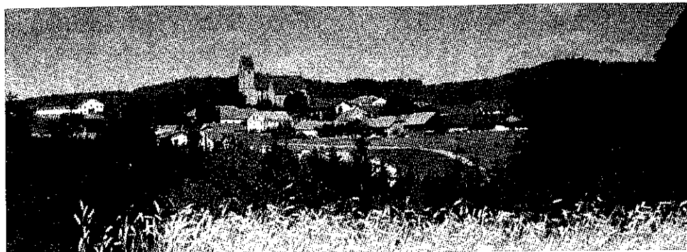
Ansicht von Rainbach.

vaten Feiern, Hochzeiten und Musikantenstammtischen in der Umgebung ihr einstudiertes Repertoire zum Besten gab.