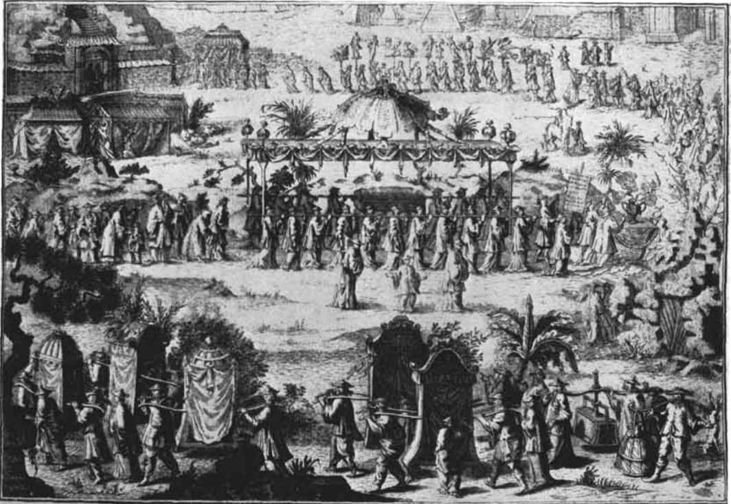
Ein Chinesisches Leichenbegängnis.