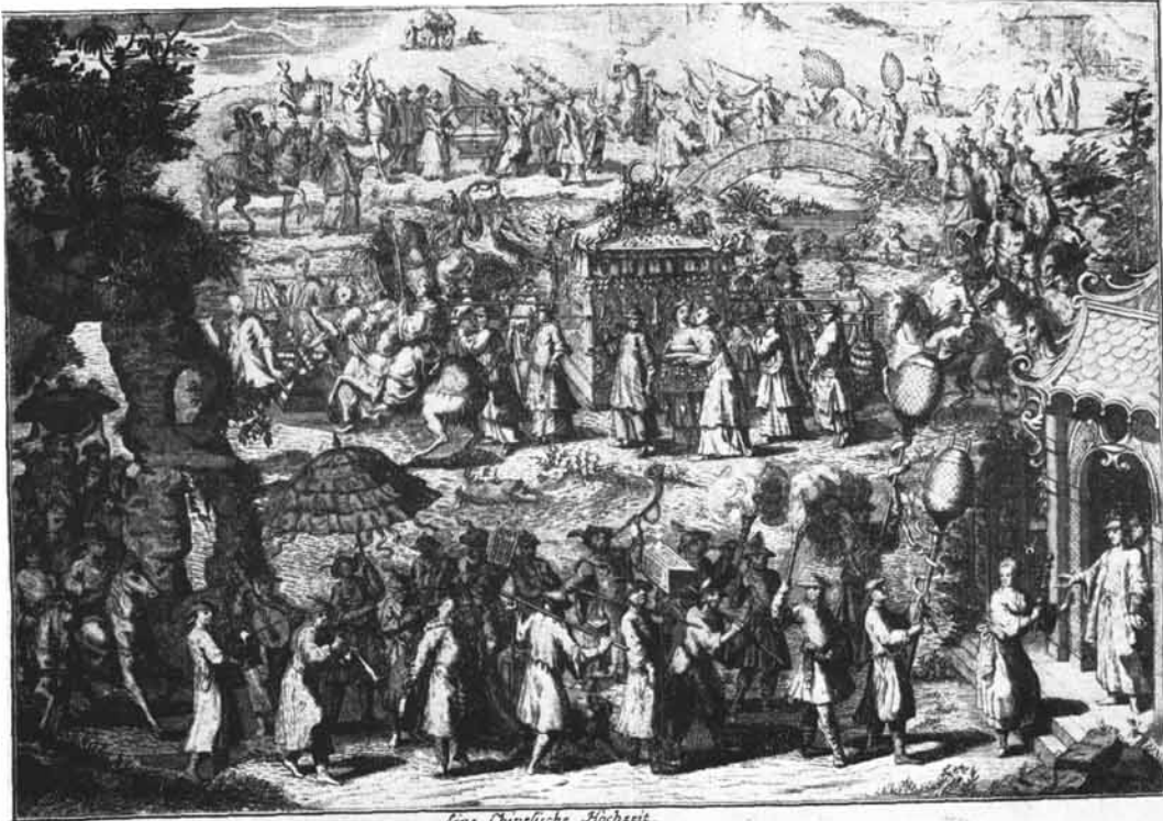
Eine Chinesische Hochzeit