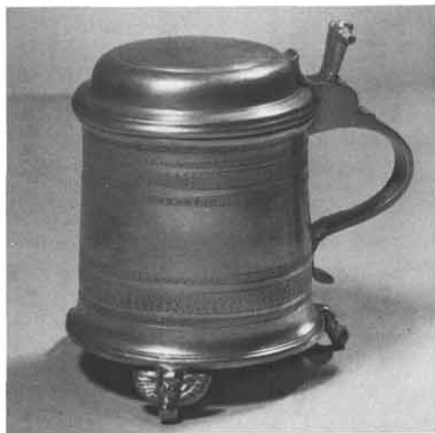
Wolf Schleicher, Meister 1662 – 1669: Fast zylindrisches Deckelkrüglein auf drei geflügelten Puttenköpfen, durch jeweils drei gestrichelte Bänder dekoriert, breit gewölbter Deckel; im Boden Gewürzglocke mit Engelsköpfchen, Höhe 14 cm. Steiermärkisches Landesmuseum Joanneum, Graz. Inv.-Nr. 7121.