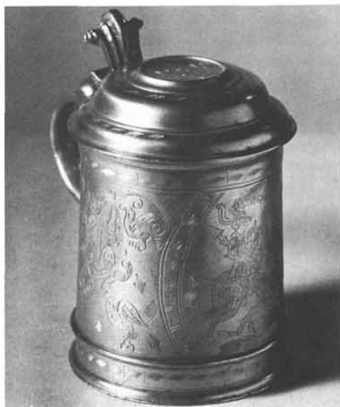
Vinzenz Burel: Fast zylindrisches Deckelkrüglein mit niedrigem Fußrand, geflechtete Dekoration mit Vögeln, Ranken und S. GEORGIVS als Drachentöter, auf dem gewölbten Deckel in der Mitte Monogramm P S P, Schildchen am Henkelansatz, Höhe 16,3 cm. Steiermärkisches Landesmuseum Joanneum, Graz. Inv.-Nr. 22.442.