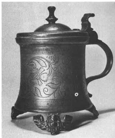
Vinzenz Burel: Fast zylindrisches Deckelkrüglein auf drei geflügelten Puttenköpfen, Verzierung mit geflechteten Blumenranken zwischen gerauhten Bändern, Deckel mit Mittelwölbung und Knauf, im Boden Rosette mit Schraube von verlorener Gewürzglocke, Höhe 15,6 cm. Steiermärkisches Landesmuseum Joanneum, Graz. Inv.-Nr. 12.419 (Museumsfoto).