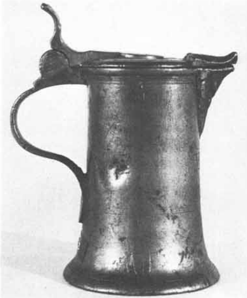
Anton Franz Dubiel: Konisches Deckelkrüglein mit profiliertem Ausguß und flachem Deckel, der Boden verbreitert, Höhe ca. 20 cm. Landesmuseum für Kärnten, Klagenfurt.

Nr. 2852/2