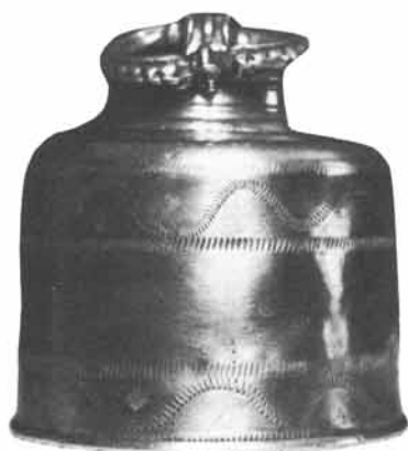
Steyrer Meister, 18. Jahrhundert: Runde Schraubflasche mit geflechteter Dekoration, am Schraubdeckel Tragring (zwei Schlangen), Höhe 10 cm, Durchmesser (Boden) 9 cm. Privatbesitz, München.

Selbstverständlich haben die Steyrer Zinngießer nicht nur prunkvolle Zunftkannen, sondern auch vielfach Gebrauchsgeräte hergestellt. Auf der Übersichtskarte „Regionale Krug- und Kannentypen“ ist als Nr. 103 etwa ein Schenkrug aus Steyr, 1720, eingezeichnet. 30 Aus einer Kärntner Privatsammlung ist ein Trinkkrug (Mostkrügel) aus Steyr, Höhe 18,5 cm, abgebildet worden. 31