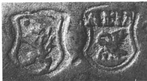
Stadtzeichen (steirischer Panther) und Meisterzeichen (Anton Franz Dubiel, Pelikan, sich die Brust aufreissend) vom Deckelkrüglein.

Foto: Landesmuseum. U.P. Schwarz. Nr. 2857