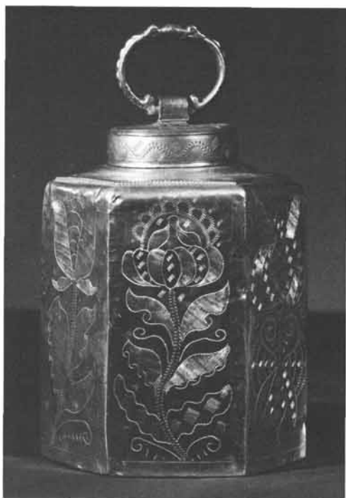
Meister G S, tätig wohl in Steyr um 1700: Sechsseitige Schraubflasche mit geflechteten Blumen, am Schraubdeckel Tragring (zwei Schlangen), Höhe 28 cm. Steiermärkisches Landesmuseum Joanneum, Graz. Inv.-Nr. 414.