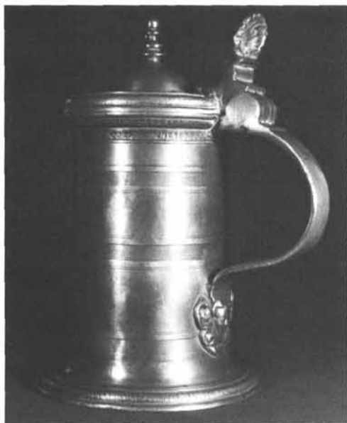
Marx Griewalt, um 1630/35: Deckelhumpen durch gepunzte Bänder und Strichgruppen dekoriert, Deckelknopf und Drücker, am Henkelansatz Maskaron, Höhe 20 cm, Kunsthandel Aachen.