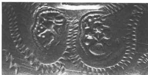
Stadtmarke von Steyr (Panther) und Meisterzeichen von Johann Michael Assam (drei Blumen auf Dreiberg, Initialen I M A) auf der Schraubflasche.

dem abnehmbaren Deckel ist ein sitzender Adler mit ausgebreiteten Schwingen zu sehen. 29