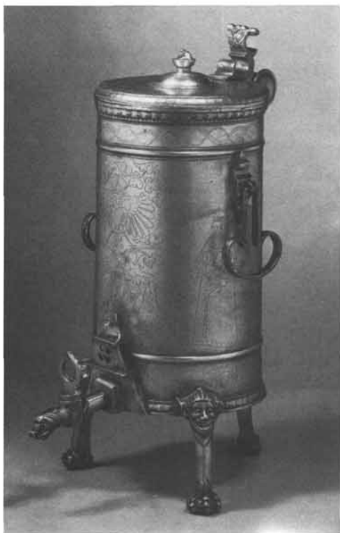
Vinzenz Burel, Meister 1618 – 1652: Zylindrische Zunftkanne der Sensenschmiede zu Rottenmann auf drei hohen Prankenfüßen mit Narrenmaske, graviert mit Doppeladler, ein Herr und drei Damen, im unteren Streifen Tiere und Blumen, Ausfuß aus großem Dreiecksansatz, seitlich zwei eiserne Griffe, flacher Deckel (Figur fehlt), Höhe 55,8 cm. Steiermärkisches Landesmuseum Joanneum, Graz (Leihgabe der Stadtgemeinde Rottenmann).

Zu den wichtigen Werken der Steyrer Zinngießer, die sich in größerer Zahl in verschiedenen Sammlungen erhalten haben, gehören die Zunftgefäße. Dazu zählten hauptsächlich große Kannen, meist als Schleifkannen bezeichnet, dazu aber auch Becher und Krüge, gelegentlich auch Salzfüßer, Teller u. a. Tafelgeschirr. Warum die eine Zunft bei den Zinngießern der Nachbarschaft, die andere von weiter weg