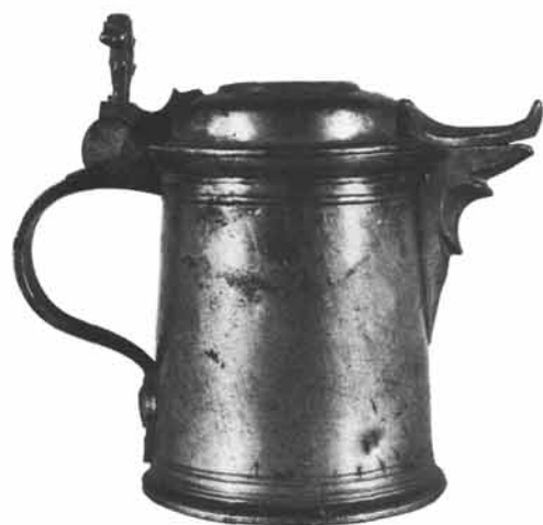
Anton Franz Dubiel, Meister 1700 – 1741: Konisches Deckelkrüglein mit profiliertem Ausguß, Höhe 16,7 cm. Landesmuseum für Kärnten, Klagenfurt.

Ein Humpen, auf drei geflügelten Engelsköpfen stehend, im Deckel mit dem Abguß einer Medaille versehen (Pax und Iustitia „IVNGVNT POST BELLA LABELLA“) mit gravierten Blumen und Ranken vom Zinngießer Anton Franz Dubiel befindet sich in der Sammlung Bey, die vor einigen Jahren in Hamburg gezeigt worden ist. 33 Das Landesmuseum für Kärnten in Klagenfurt verwahrt – zusätzlich zu den bei Hintze als im Besitz des „Geschichtsvereins für Kärnten“ befindli-