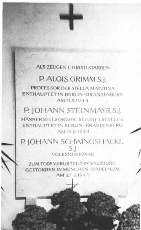
Gedenktafel in der Dreifaltigkeitskirche (Universitätskirche) in Innsbruck, Seitenkapelle, am 13. Juni 1985 enthüllt und gesegnet.