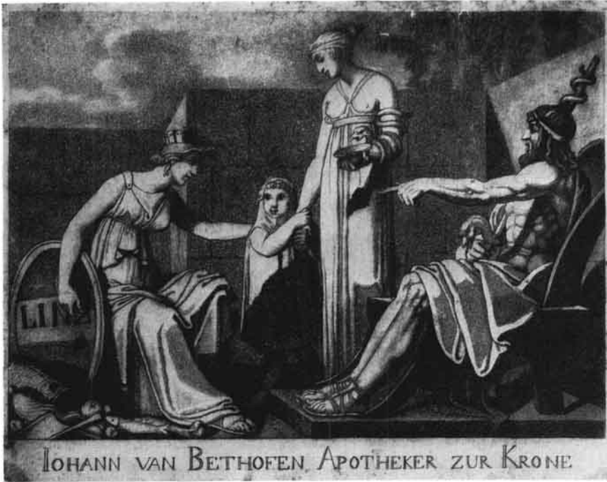
Karl Ruß, Werbeblatt des Apothekers „Zur (goldenen) Krone“ Johann van Beethoven, Aquatinta um 1810. Im Bild links die sitzende „Linz“, rechts auf einem Thronessel Aeskulap. (Oö. Landesmuseum)