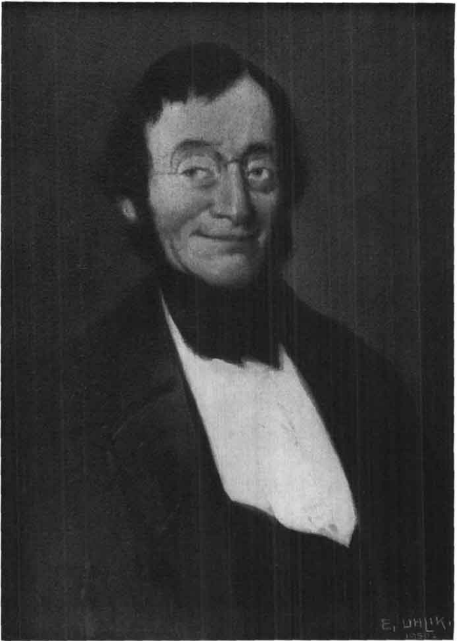
Porträt des Linzer Apothekers Johann van Beethoven. Kopie nach dem Original eines unbekanntten Malers im Historischen Museum der Stadt Wien von Eduard Uhlik, 1950. (Mag. Zuleger, Linz, Wasserapotheke)