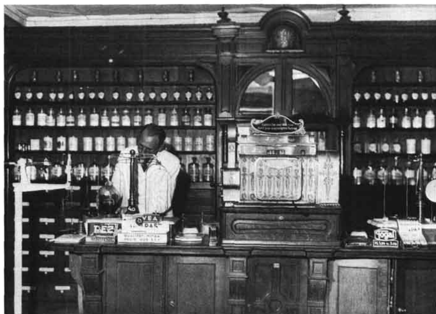
Inneres der Wasserapotheke (wie Tafel VIII unten). (Mag. Zuleger, Linz, Wasserapotheke)