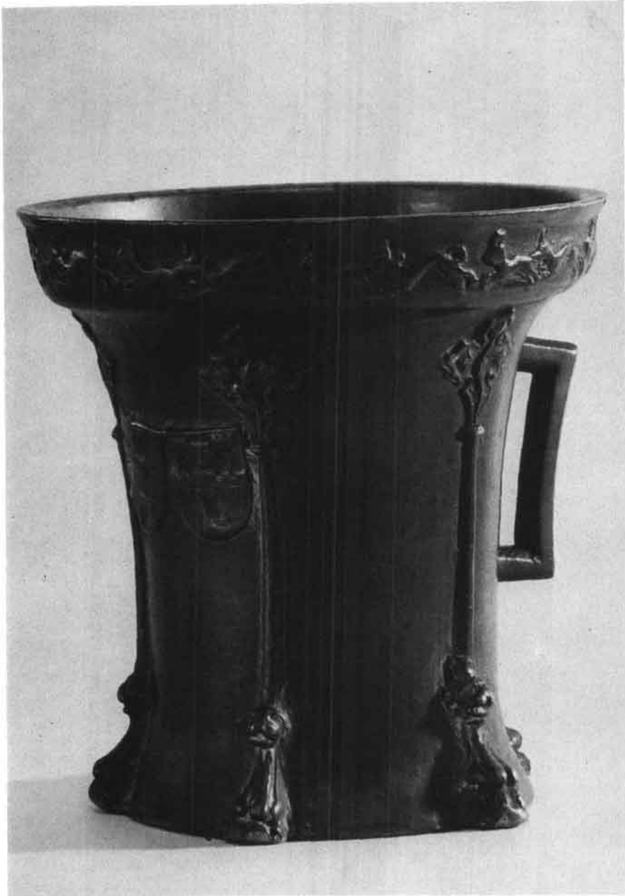
Gotischer Linzer (?) Apothekenmörser mit Stadtwappen und Gießerzeichen, 3. Viertel 15. Jahrhundert. (Stadtmuseum Linz)