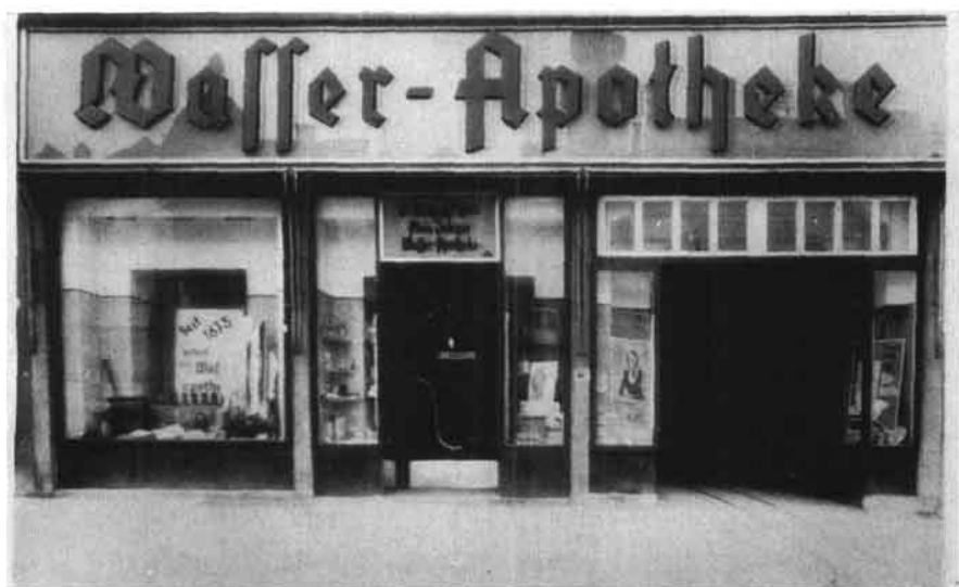
Wasserapotheke auf dem Hauptplatz Nr. 16, 1938 — 1948.