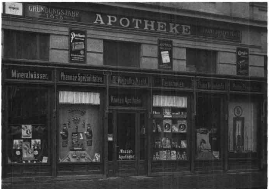
Wasserapotheke auf dem Hauptplatz Nr. 7 (früher Nr. 2) zwischen 1872 und 1938. (Mag. Zuleger, Linz, Wasserapotheke)