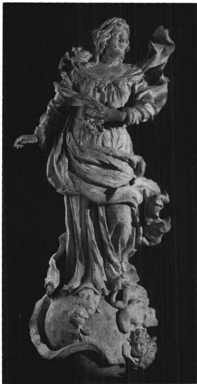
Barocke Immakulata vom alten Apothekerhaus bei der Donaubrücke, 1730. (Stadtmuseum Linz)