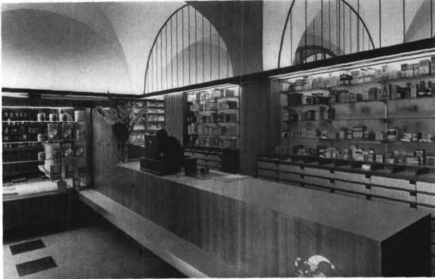
Inneres der Wasserapotheke nach dem Umbau 1960. (Mag. Zuleger, Linz, Wasserapotheke)