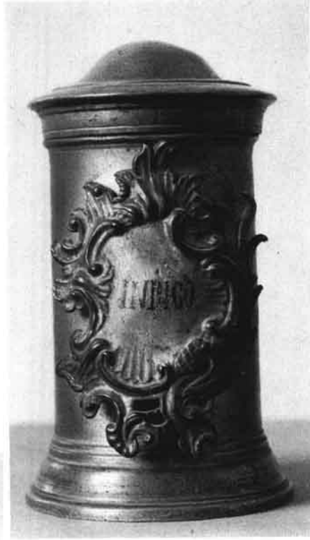
Spätbarockes Apothekengefäß, nach 1750. (Mag. Zuleger, Linz, Wasserapotheke)