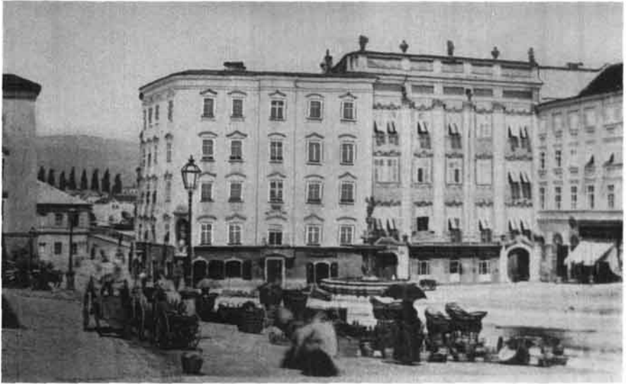
Apothekehaus und Spindlersches Freihaus auf dem Hauptplatz, davor Jupiterbrunnen, Foto um 1860/70. (Mag. Zuleger, Linz, Wasserapotheke)