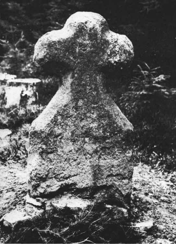
Abb. 5: Franzosenkreuz in Hellmonsödt