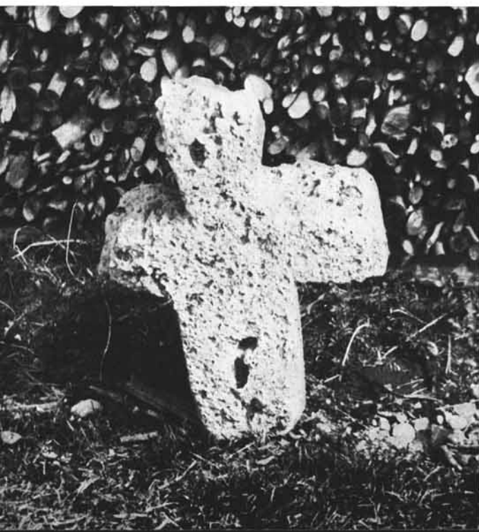
Abb. 8: Steinkreuz in Steyr-St. Anna