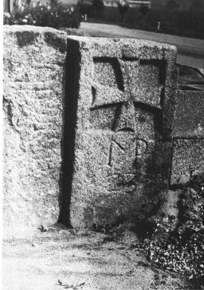
Abb. 6: Burgfriedstein in Perg