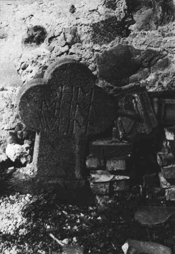
Abb. 1: Pestkreuz (?) in Dürnbach b. Ternberg