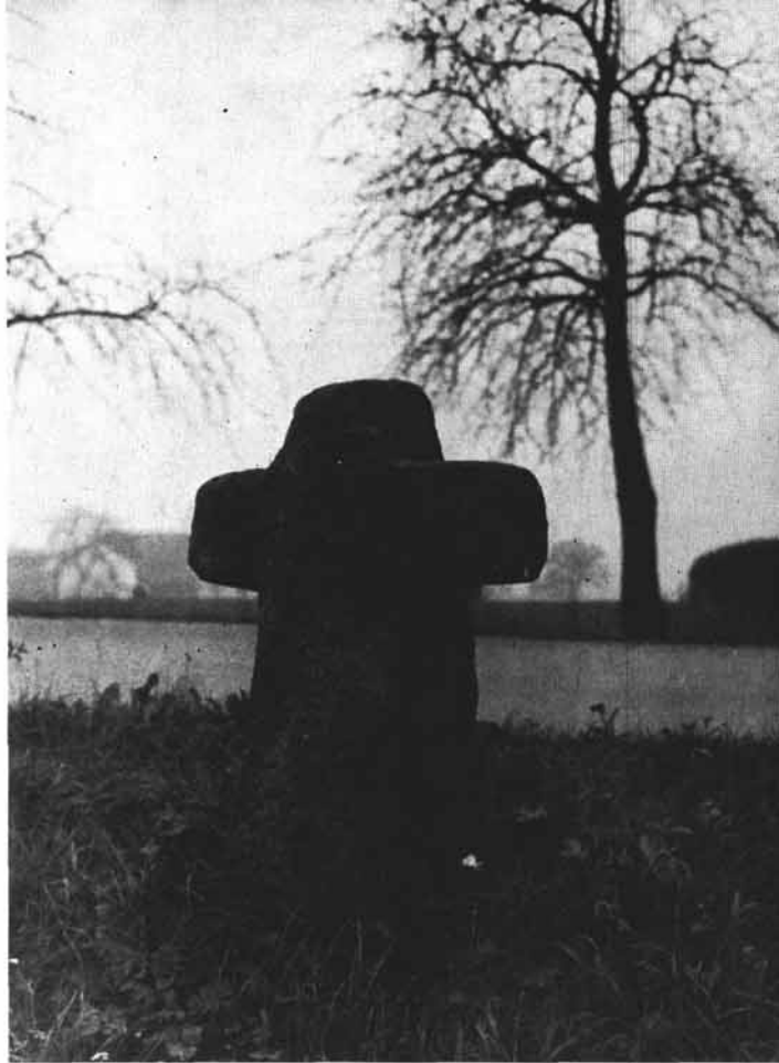
Abb. 2: Steinkreuz in Edenrad b. Eggerding

Zu: A. Paul, Steinkreuze und Kreuzsteine