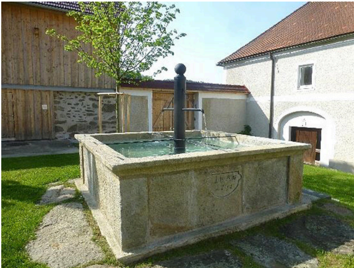
Die Internationale Tagung wird im Stiftsmeierhof in Eidenberg abgehalten.