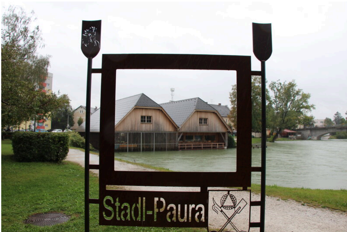
Die Salzstadeln in Stadl-Paura konnten im Rahmen der Tagung aufgrund des Hochwassers nicht besichtigt werden.