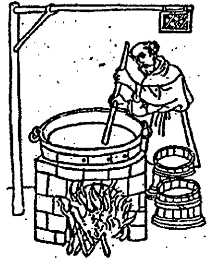
Bierbrauer. Holzschnitt aus dem 16. Jh..

Und die Bierbrauer verstanden es, sich eine Reihe von Heiligen als Fürsprecher im Jenseits zu sichern – infrage kam dafür so ziemlich jeder, dessen Attribute zur Bierbrauerei passten – vom Heiligen Florian (der in Wasser ertränkt wurde und daher mit einem Kübel dargestellt wird) bis zum Heiligen Laurentius. Laurentius war ein frühchristlicher Märtyrer, Erzdiakon unter Papst Sixtus II., der im Jahr 258 Opfer der Christenverfolgung im Alten Rom wurde. Laurentius hatte zu Lebzeiten mit Bierbrauerei allerdings wenig zu tun – wohl aber inspirierte seine Todesart die Brauer und Mälzer dazu, Laurentius für sich zu vereinnahmen: Laurentius wurde nämlich (nachdem er die von der römischen Obrigkeit zur Konfiskation bestimmten) Schätze der