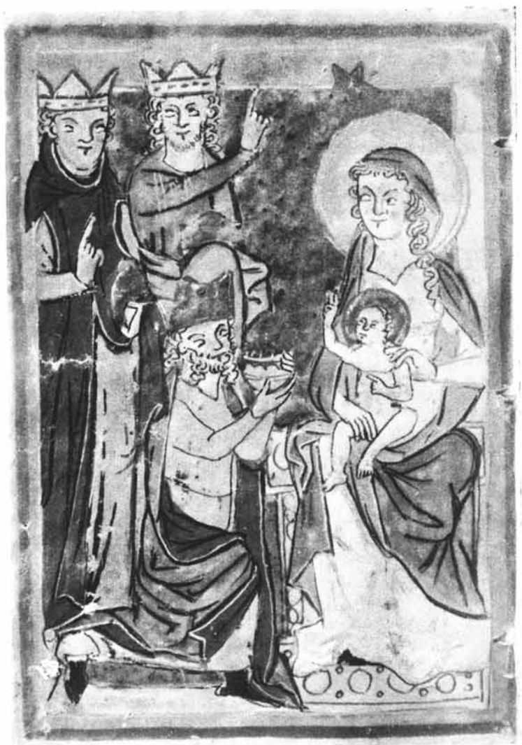
Abb. 8: Epiphanie aus einem Psalter, ehemals in der Windhager Bibliothek. Wien, Österreichische Nationalbibliothek