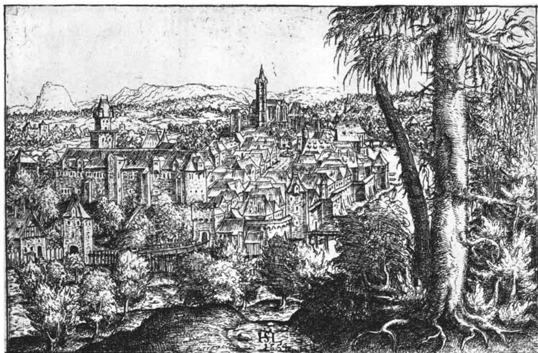
Abb. 1: Steyr im Jahre 1554. Radierung von Hanns Lautensack. Veröffentlicht mit Genehmigung der Albertina, Wien.