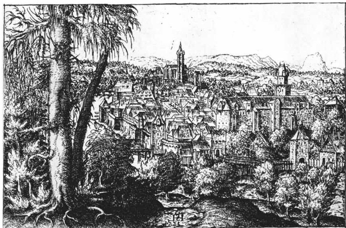
Abb. 2: Steyr im Jahre 1554. Radierung von Hanns Lautensack, seitenverkehrt zum Original, der Wirklichkeit entsprechend.