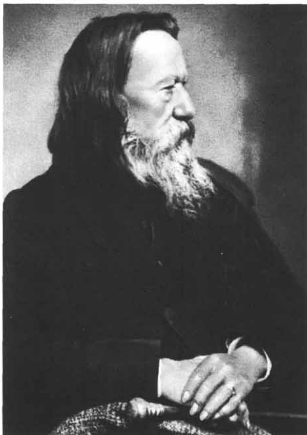
Franz Stelzhamer.

Den letzten Schritt zum sprachlichen Realismus innerhalb der poetischen Welt macht die Mundartdichtung . Das 19. Jahrhundert geht auch hier folgerichtig den Weg von der Romantik zur Wirklichkeitserfassung. Im bajuwarischen Raum wird Oberösterreich das klassische Land der Mundartpoesie. Noch im 18. Jahrhundert war der Lambacher Benediktiner Maurus Lindemayr (1723 – 1783) mit Dialektgedichten und bäuerlichen Spielen vorangegangen. Dann aber wird Franz Stelzhamer der unumschränkte Herrscher in diesem Raum. Sein ursprünglicher Ehrgeiz gilt zwar dem Dichterlorbeer in der Hochsprache, doch bald erkennt er richtig: „Meine hochdeutschen Sachen finden wenig Anklang, meine Prosa auch nicht. Das oberdennsische Lied ist meine Heimat, da herrsche ich allein“. Adalbert Stifter, seit langem mit Stelzhamers menschlicher und künstlerischer Persönlichkeit vertraut (Stelzhamer war u. a.