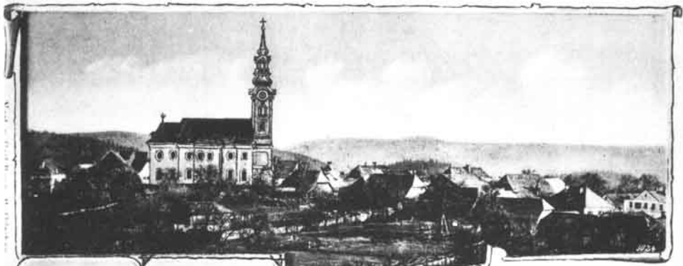
Gruss aus Hofkirchen im Mühlkreis.