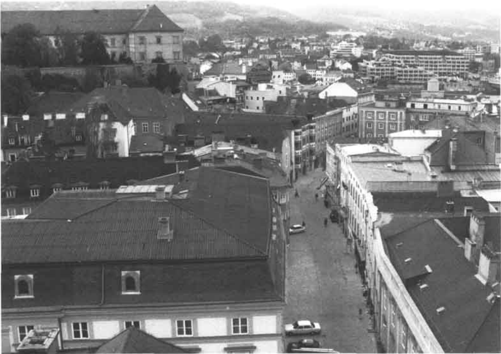
Blick vom Landhausturm gegen Norden.