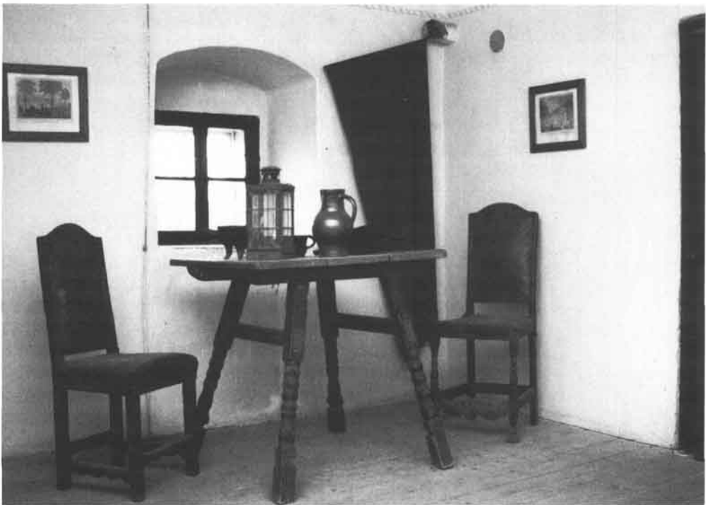
Die Türmerstube am Landhausturm mit der Signalfahne.

1898 wurde hinsichtlich der Alarmierung bei Bränden eine Verbesserung versucht. Einige Türme, Kapuziner- und Elisabethinenturm, wurden mit Klingelanlagen versehen, die vom Pfarrturm aus das Signal bekamen. Das ließ sich aller-