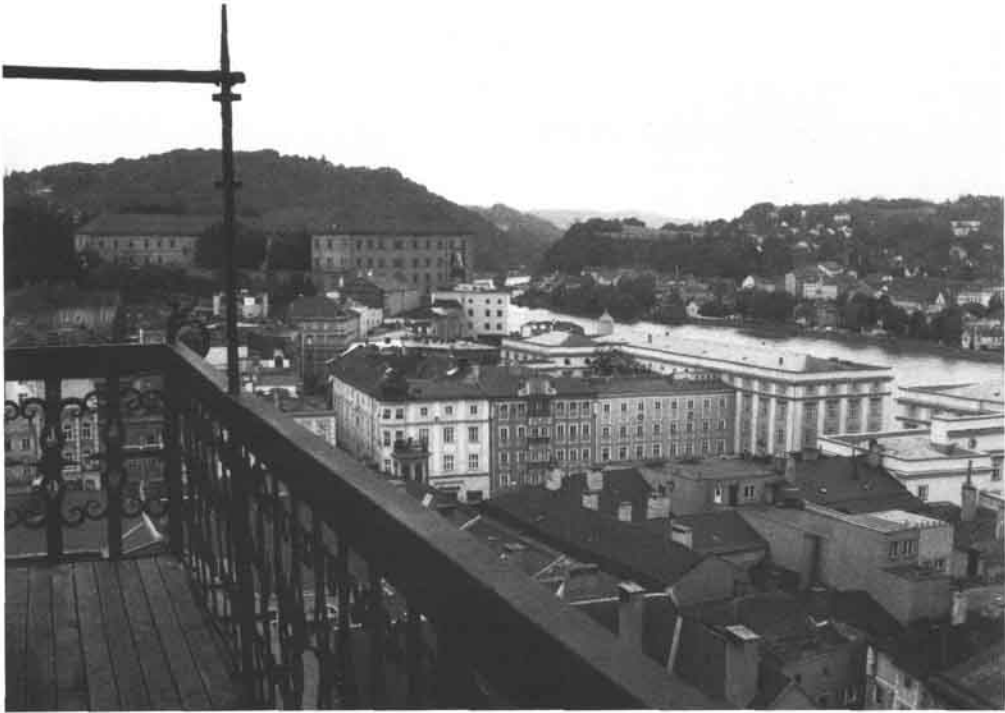
Blick vom Turm der Stadtpfarrkirche gegen Westen.