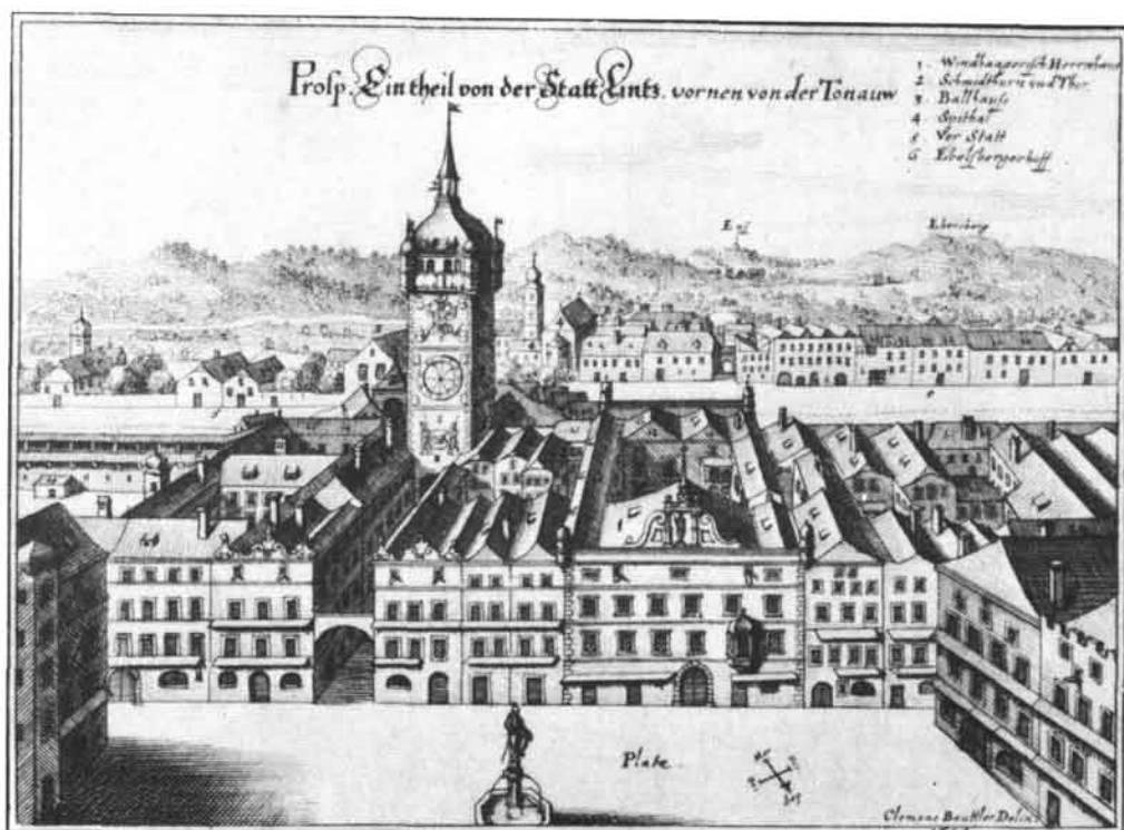
Vogelschau vom Hauptplatz nach Süden (Schmidtturm). Kupferstich aus 1654 von Caspar Merian nach Clemens Beuttler (Stadtmuseum Linz)

Nach dem Abbruch des Schmidturmes hatte sich der Konvent der Elisabethinen in Linz bereits im April 1828 an den Magistrat um Überlassung der Turmuhr gewendet, später aber wieder auf die schon bewilligte Spende verzichtet, da die Reparatur des alten Werkes zu teuer gekommen wäre. Mit Rücksicht auf die traurige Lage, in der sich Schörfling nach dem Marktbrand am 12. April 1828 befand, bei dem