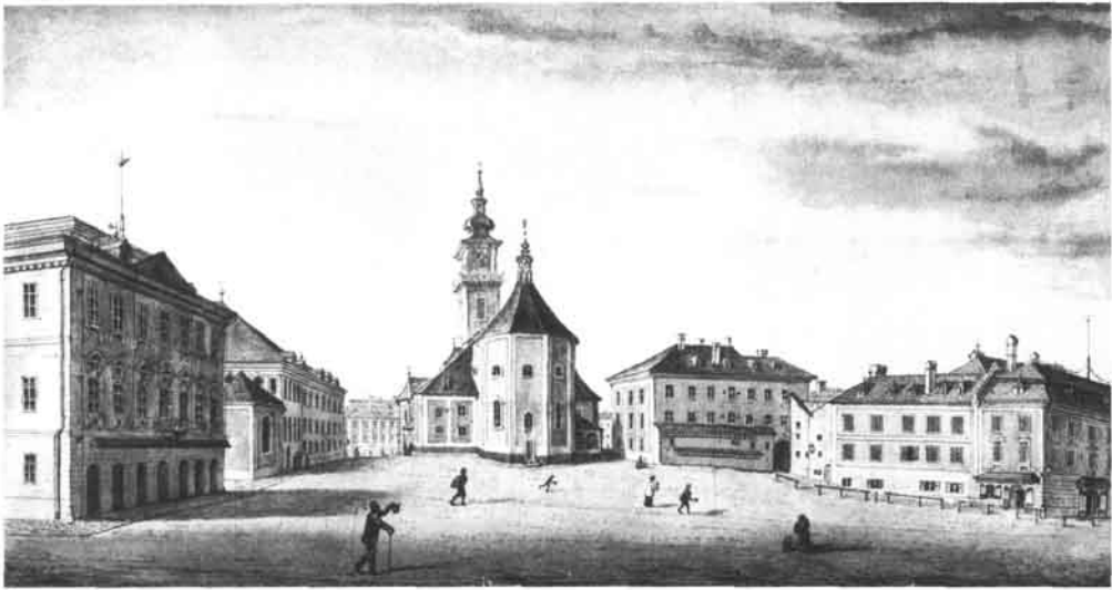
Der Pfarrplatz von Osten. Federzeichnung um 1850 (Stadtmuseum Linz)

gelangte bis in die sogenannte Kugel. Dadurch kam er mit dem Türmer in ein freundschaftliches Verhältnis, für den diese Besuche eine Abwechslung bildeten. Er schreibt: