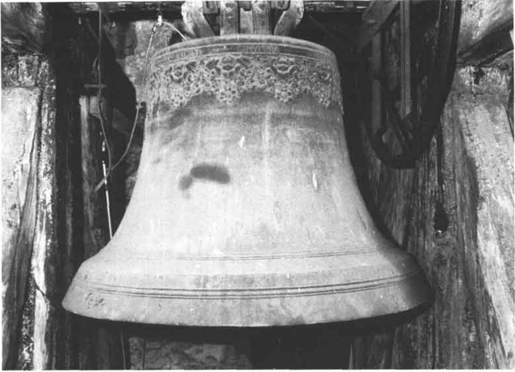
Die „Kaiserin“ der Stadtpfarrkirche.