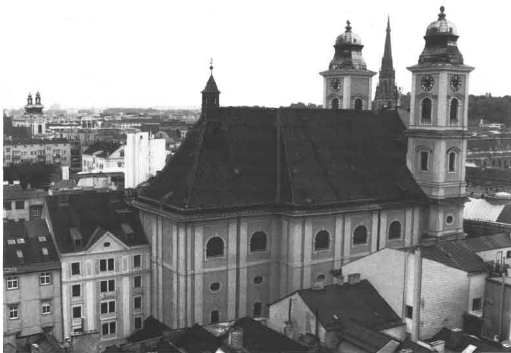
Blick vom Turm der Stadtpfarrkirche über die Türme von Linz.