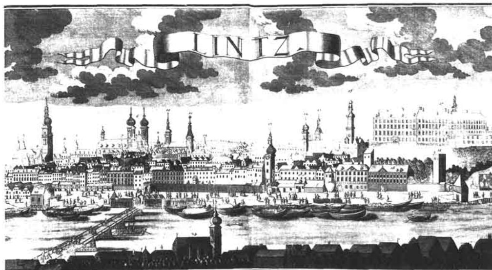
Linz von Norden. Kupferstich aus 1732 von Johann Friedrich Probst nach Bernhard Friedrich Werner (Stadtmuseum Linz)

Vergessen aber sind die Türmer, die einmal angesehene Leute waren. In der Literatur, die über die Stadtpfarre, den Schmidtturm und den Landhausturm berichtet, sind nur wenige Hinweise über die Arbeit und das Leben der Türmer und deren Familien zu finden.