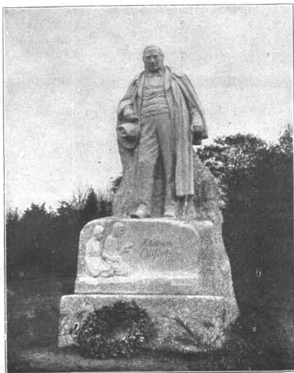
Das Stifter-Denkmal in Wien.