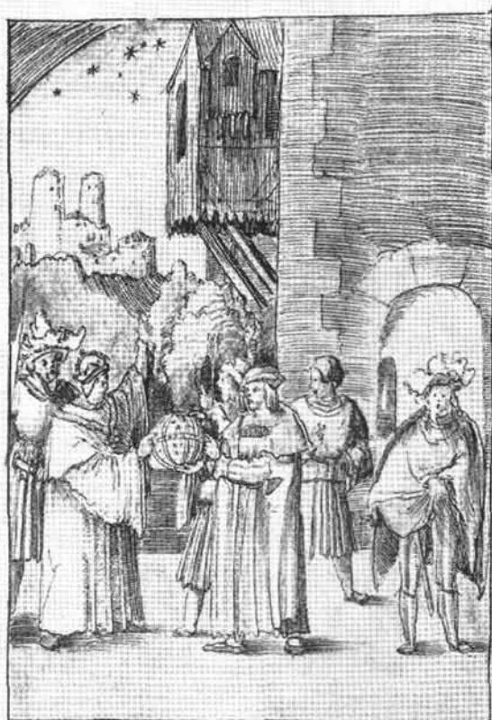
Torhalle der Linzer Burg zu Ende des 15. Jahrhunderts; Kaiser Friedrich im Gespräch mit den Hofastrologen (Reproduktion nach Benesch- Auer, Die Historia Friderici et Maximiliani , Berlin 1957).