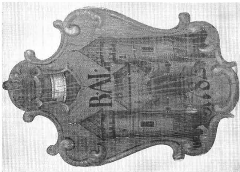
Hausschild des Bürgermeisteramtes Linz (chem. Sammlung Pachinger), Stadtmuseum Inv.-Nr. 760.