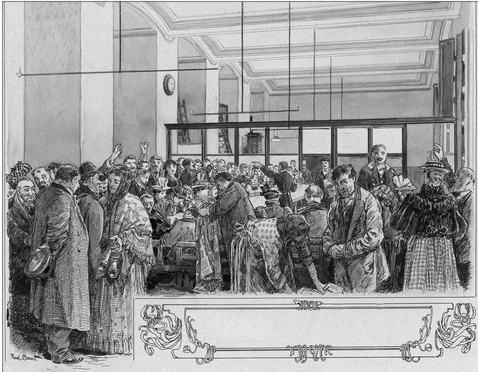
Abb. 5: Betrieb in der Leihanstalt. Illustration der Festschrift von 1899. Originalzeichnung von Rudolf Bernt im Archiv der Allgemeinen Sparkasse Oberösterreich.

Für diese Entschließung (in der Vollversammlung von 1911) war in erster Linie maßgebend, daß die Leihanstalt mehr von humanitären und sozialen, als von kaufmännischen Gesichtspunkten geführt wurde und daher nicht mit Gewinn, sondern mit stets steigenden Verlusten arbeitete, welche von der Sparkasse gedeckt werden mußten. Ein Abgehen von der angedeuteten humanitären Führung der Leihanstalt hielt man jedoch nicht für opportun, da ja die bis dahin von der Sparkasse der Leihanstalt gebrachten Opfer von den Kunden der Leihanstalt am wenigsten erkannt und anerkannt wurde. Da zudem auch noch bauliche und hygienische Reorganisationen des veralteten Leihanstaltsbetriebes notwendig gewesen wären, welche unverhältnismäßig hohe Kosten verursacht hätten, so war der Anlaß zu dem Auflösungsbeschlusse gegeben, umso mehr, als sich der Ausweg fand, die Leihanstalt der Stadtgemeinde Linz abzutreten, wofür letzterer allerdings noch ein Entschädigungsbetrag zu bezahlen war.