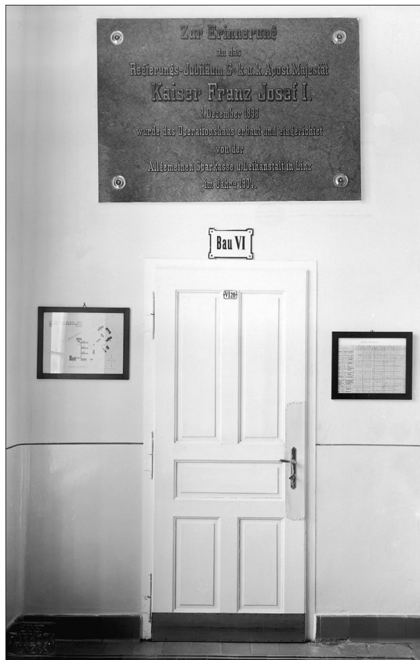
Abb. 10: Gedenktafel im ehemaligen Operationshaus des Allgemeinen Krankenhauses der Stadt Linz, Krankenhausstraße 8. Abgerissen für den Neubau des Allgemeinen Krankenhauses 1990–2000.