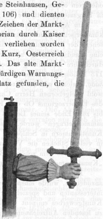
Abb. 3. Markttrichtschart aus St. Florian.

bei der Kirche aufgerichtet (vergleiche Steinhausen, Geschichte der deutschen Kultur, Seite 106) und dienten als drohende und schreckende äußere Zeichen der Marktgerichtsbarkeit (die dem Dorfe St. Florian durch Kaiser Friedrich IV. bereits im Jahre 1493 verliehen worden ist; die Urkunde ist abgedruckt bei Kurz, Oesterreich unter Kaiser Friedrich IV., Seite 307). Das alte Marktrichtschwert hat neben den drei altehrwürdigen Warnungstafeln aus dem Linzer Landhause Platz gefunden, die neben ihren Inschriften einen ähnlichen Arm samt Schwert aufgemalt zeigen. Wir verdanken dieses schöne Justizaltertum dem freundlichen Entgegenkommen der Marktkommune St. Florian und der gefälligen Vermittlung des Herrn Landesarchivars Dr. Zibermayr .