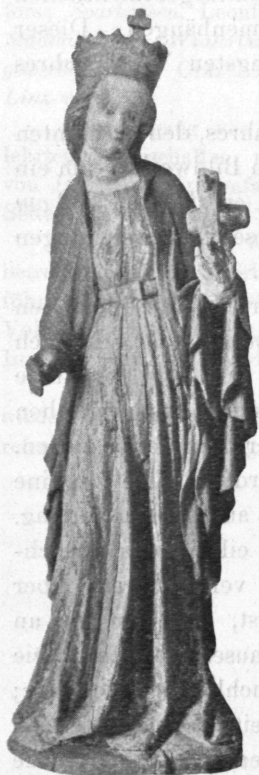
Abb. 1. Heil. Katharina (gotische Holzfigur).

Aus Linz selbst stammt das große schmiedeeiserne Oberlichtgitter vom Landstraßenportal der demolierten Trainkaserne , ein Geschenk der Stadtgemeinde an das Museum. Durch den immer wieder erneuerten Anstrich hatte diese Oberlichte ein plumpes Aussehen gewonnen; jetzt, nach gründlicher Reinigung, zeigt sich die Komposition der edlen Kunstschmiedearbeit wieder in ihrer ganzen Schönheit; sogar die reichen Gravierungen der Blätter an den schmiedeeisernen Ranken sind wieder sichtbar geworden. (Abb. 2.) Das Stück, das eine