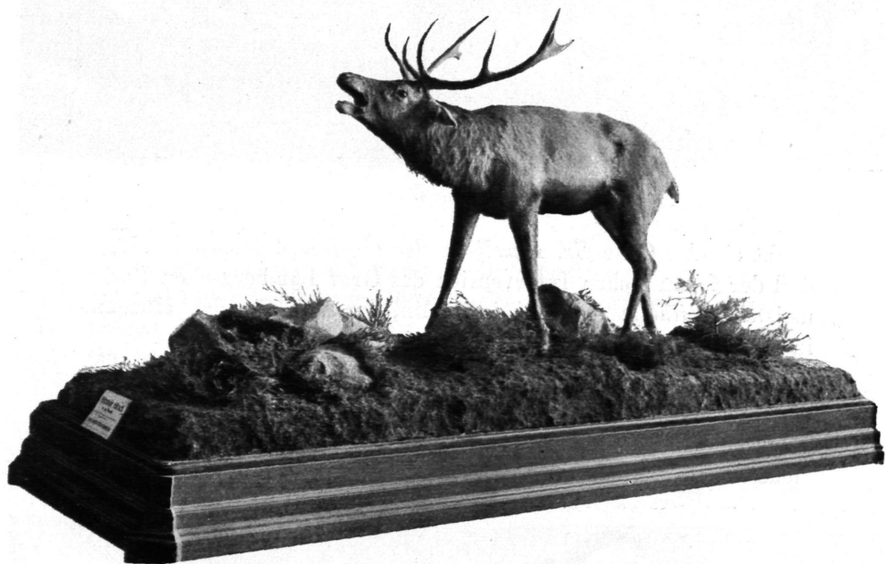
Der röhrende Hirsch.