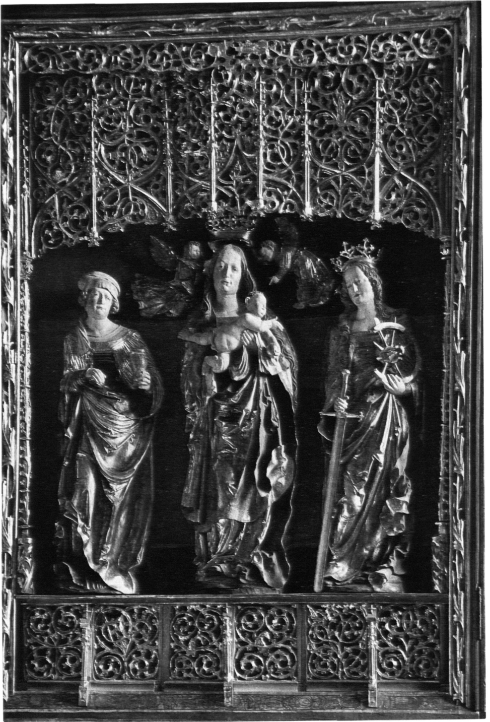
Abb. 2. Schrein eines Flügelaltars in Waldburg bei Freistadt Links: Maria Magdalena, Mitte: Maria mit Kind, rechts: Barbara (Zu S. 341 f.)