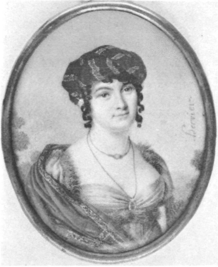
Abb. 9: Inv.-Nr. G 1489 Marie Antoine Hervier, Damenporträt, Paris um 1800 (Kat. Nr. 120)