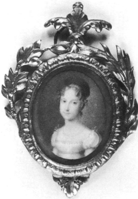
Abb. 8: Inv.-Nr. G 563 Peter Jensen Bloch, Damenporträt, Kopenhagen um 1800 (Kat. Nr. 218)