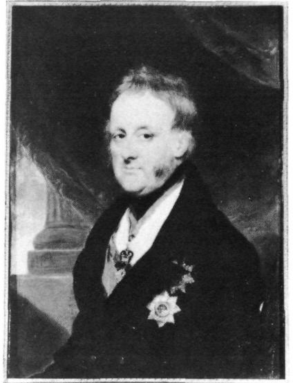
Abb. 14: Inv.-Nr. G 2047 Moritz Michael Daffinger, Fürst Joseph Johann Schwarzenberg, Wien vor 1833 (Kat. Nr. 142)