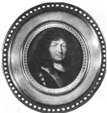
Abb. 1: Inv.-Nr. G 988 Jean Petit d. Ä., Ludwig XIV. von Frankreich, Frankreich 4. V. 17. Jh. (Kat. Nr. 5)