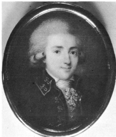
Abb. 2: Inv.-Nr. G 1350 Franz Joseph Noortwyck, Herrenporträt, Bad Dürkheim 1787 (Kat. Nr. 79)