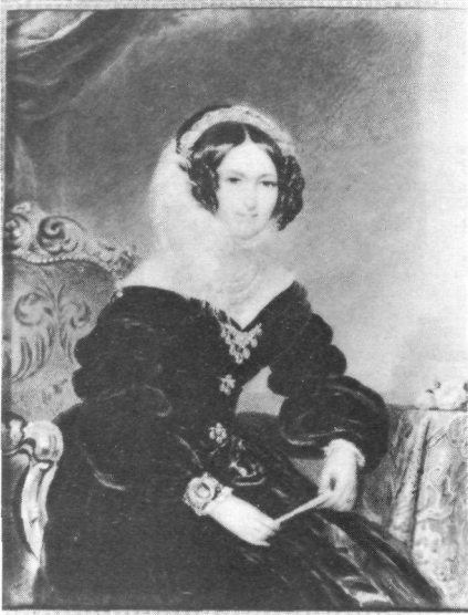
Abb. 21: Inv.-Nr. G 2055 Emanuel Peter, sitzende Aristokratin, Wien 2. V. 19. Jh. (Kat. Nr. 163)