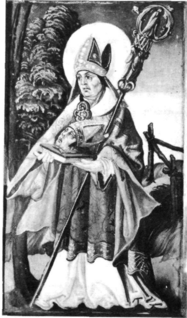
Abb. 10: Hl. Dionysius, um 1525. Kremsmünster, Stiftssammlung.