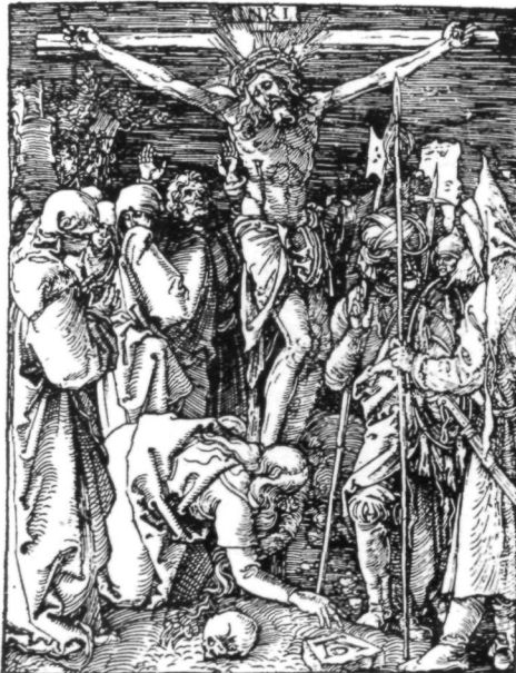
Abb. 3: Albrecht Dürer, Kreuzigung Christi, 1511 (Kleine Holzschnittpassion – B. 40).