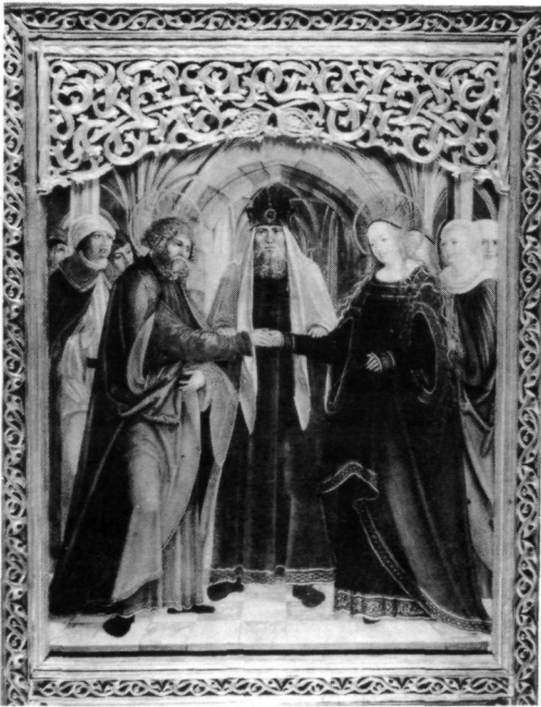
Abb. 12: Vermählung Mariae, Hallstätter Marienaltar, um bzw. kurz vor 1520.