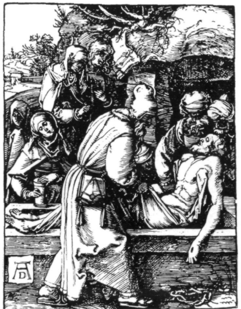
Abb. 4: Albrecht Dürer, Grablegung Christi, 1511 (Kleine Holzschnittpassion – B. 44).