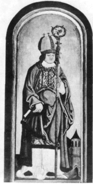
Abb. 9: Hl. Wolfgang, Schrein- standflügel des Altars der Filialkirche St. Michael bei Oberrauchenöd, 1527.