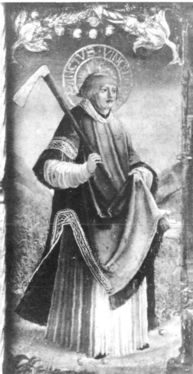
Abb. 7: Hl. Vinzenz von Saragossa, Predellenstandflügel vom Hallstätter Altar; um bzw. kurz vor 1520.