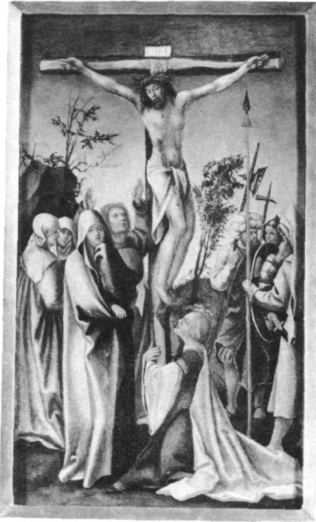
Abb. 1: Kreuzigung Christi, Stift Schlägl, Gemäldesammlung (nach Restaurierung).