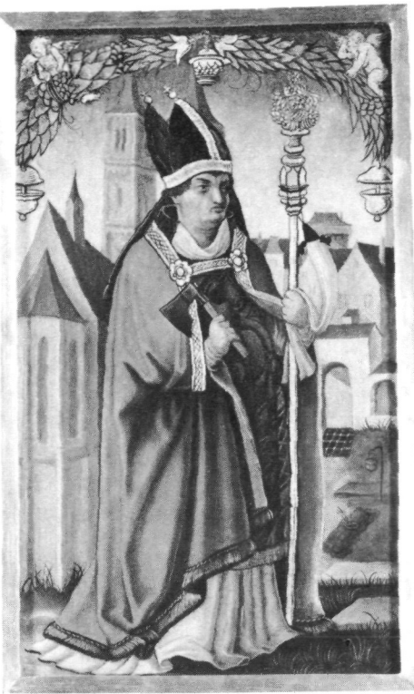
Abb. 5: Hl. Wolfgang, Stift Schlägl, Gemäldesammlung.