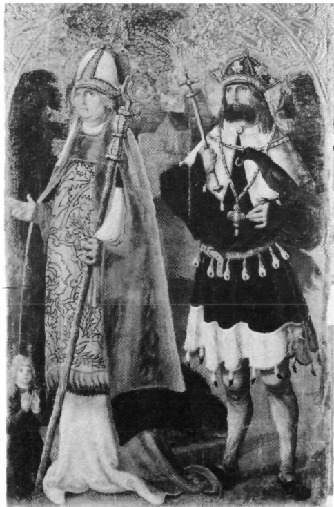
Abb. 8: Hll. Willibrord und Oswald, um 1515, Wien, Gemäldegalerie der Akademie der bildenden Künste (Depot, Inv.-Nr. 550).