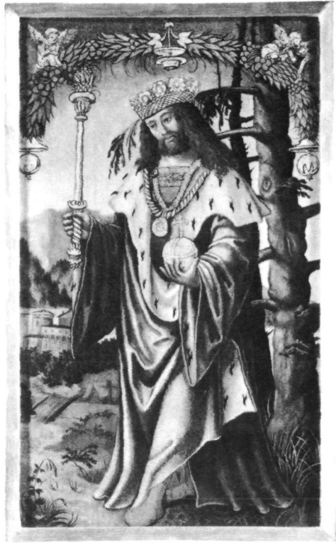
Abb. 6: Hl. König (Sigismund?), Stift Schlägl, Gemäldesammlung.