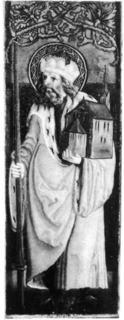
Abb. 11: Hl. Leopold, um 1515. Kremsmünster, Stiftssammlung.