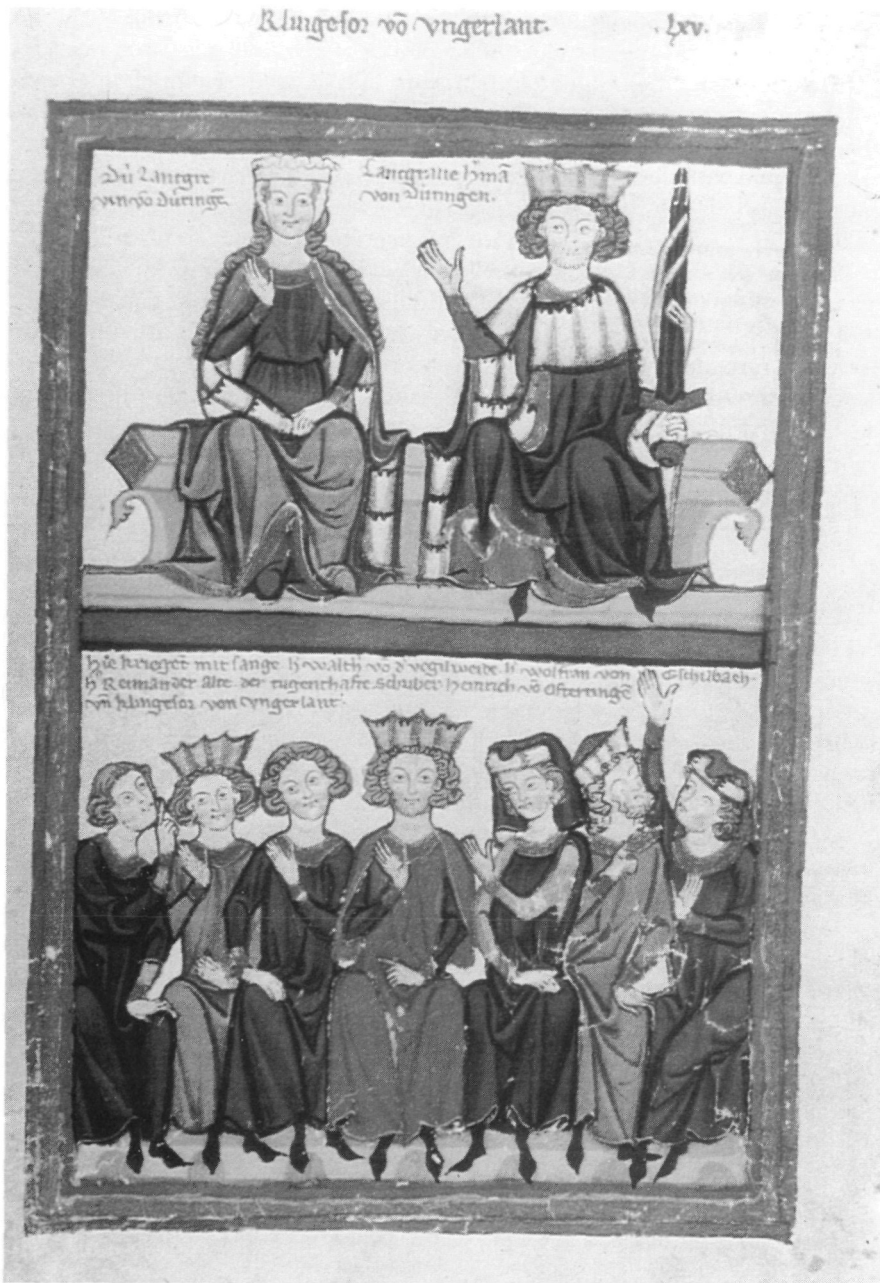
Abb. 2: Der Sängerkrieg auf Wartburg im Codex Manesse.