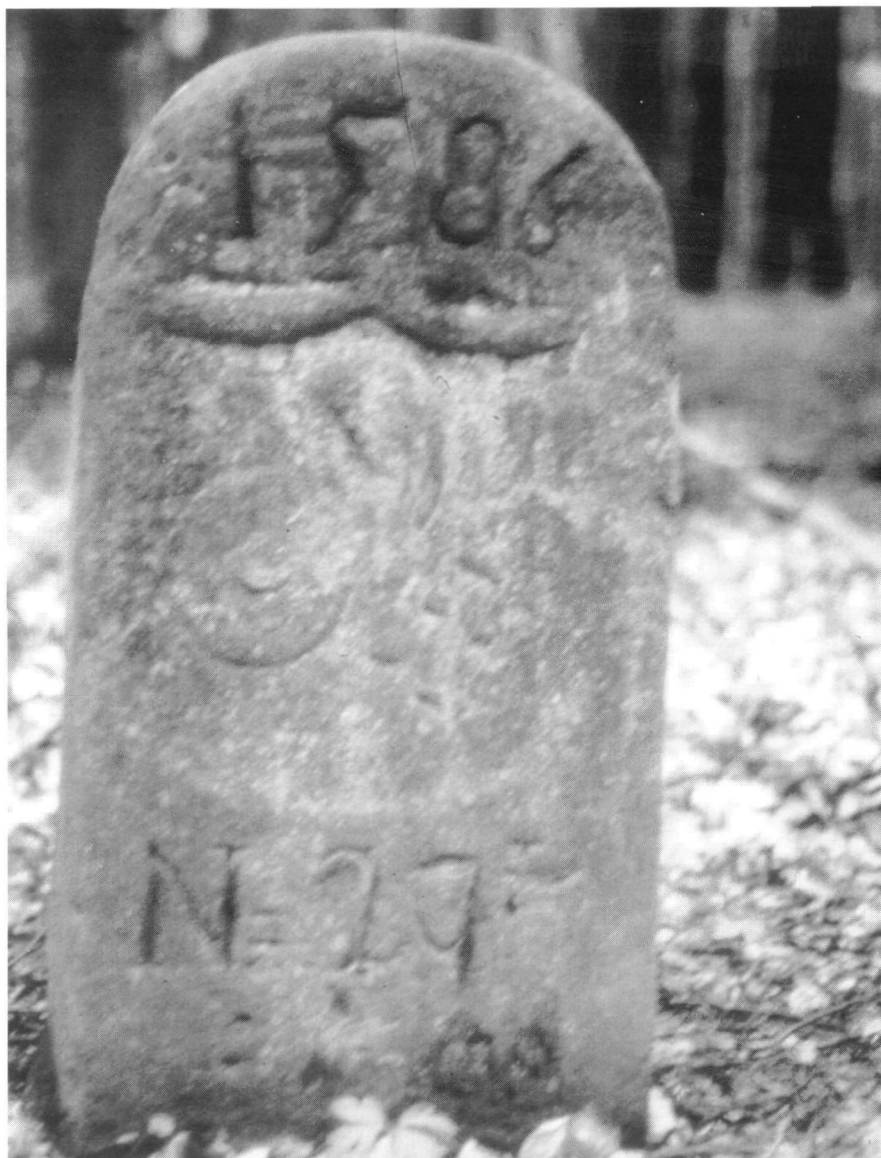
Abb. 10: Kürenbergs Wappen im Vierdörferwald im Breisgau.

wappen aufgefaßt wurde. Diese Entdeckung sagt jedoch nichts darüber aus, daß der Dichter der Breisgauischen Familie entstammen müßte. Das Wappen zeigt lediglich, daß offenbar der Ortsname Kürenberg zu einem