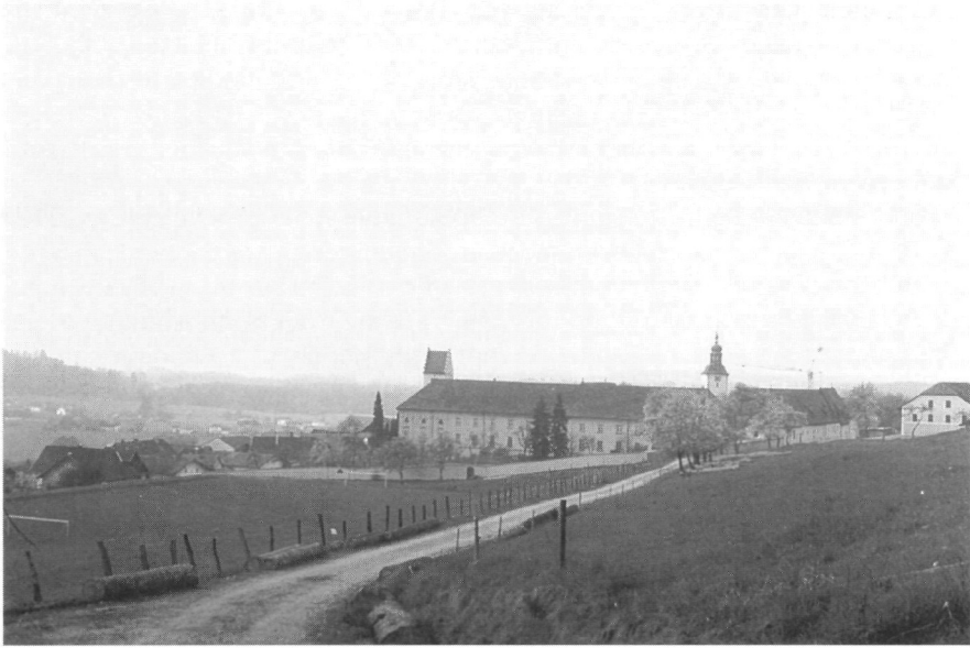
Abb. 11: Michaelbeuern

Der König Rother ist nun eine phantasievolle Werbegeschichte. Werbe- strophen stehen auch im Mittelpunkt der Dichtung des Kürenbergers 69 . Manche Forscher, wie Volker Schupp , haben deshalb daran gedacht, die Lieder des Kürenbergers könnten auch liedhafte Einschübe in einem sonst in Prosa erzählten „Roman“, der ritter edele also nicht das lyrische Ich des Kürenbergers, sondern eine Romanfigur sein 70 .