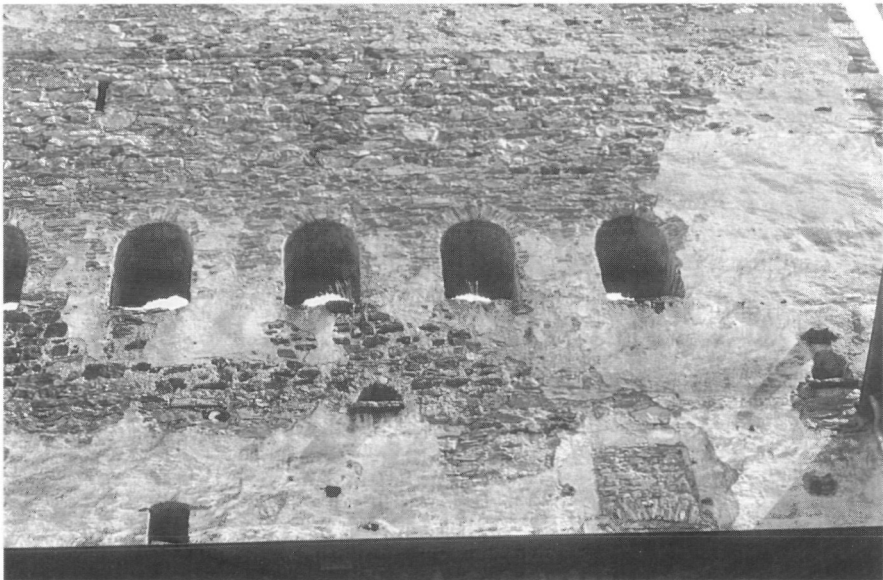
Abb. 12: Der romanische Palas der Schallaburg.