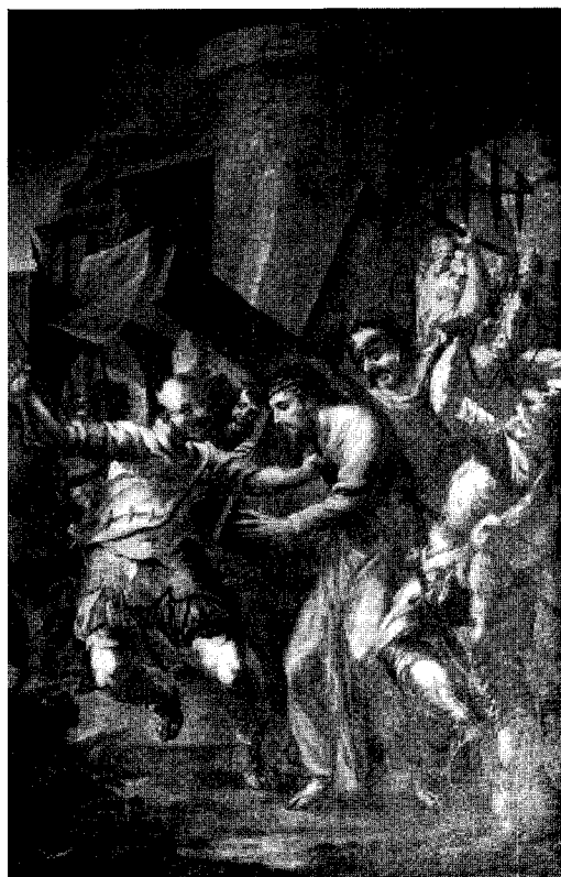
Abb. 2. Wimsbach