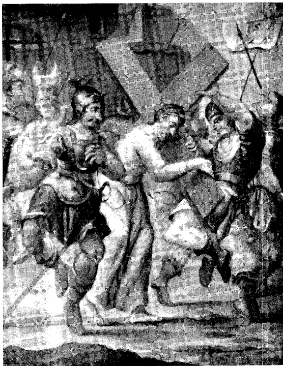
Abb. 4. St. Pankraz