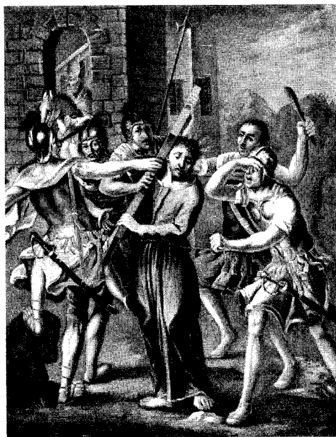
Abb. 3. St. Georgen, dzt. Wels, Museum