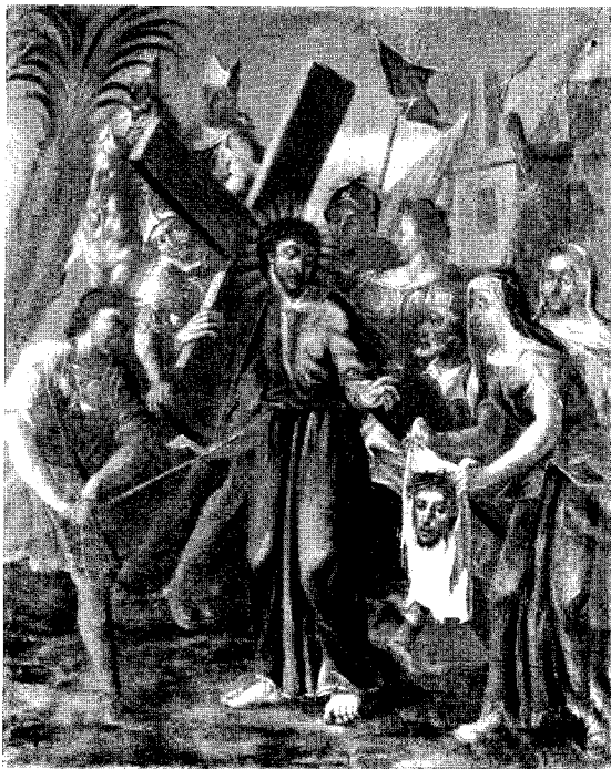
Abb. 7. Wörsbach