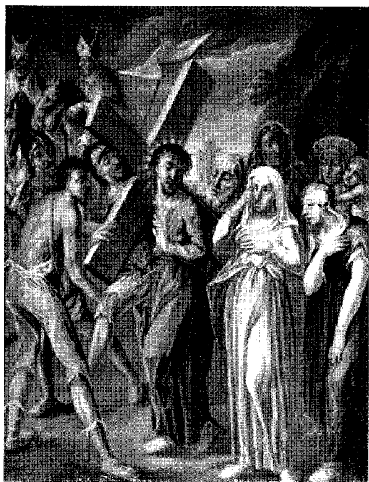
Abb. 9. St. Georgen, dzt. Wels, Museum Kreuzwege der Heindl-Werkstatt

VIII. Station: Christus begegnet den weinenden Frauen.