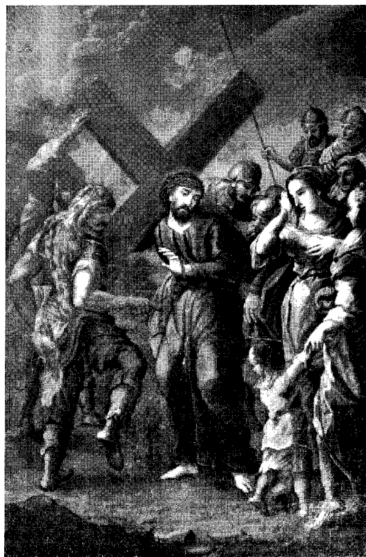
Abb. 10. Wümsbach

X. Station: Christus wird der Kleider beraubt.