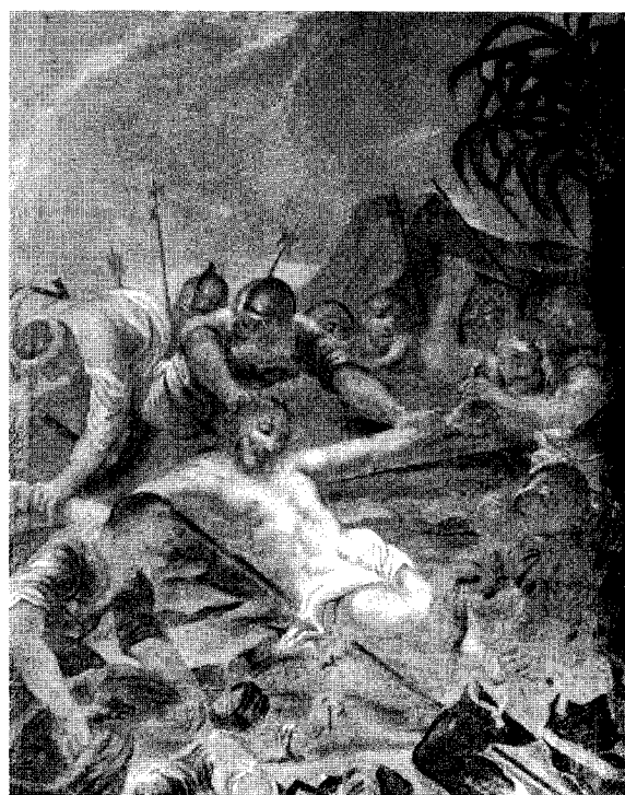
Abb. 16. Pichl b. Wels