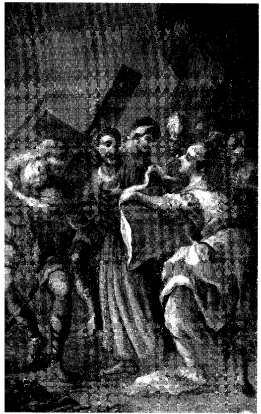
Abb. 6. Wels