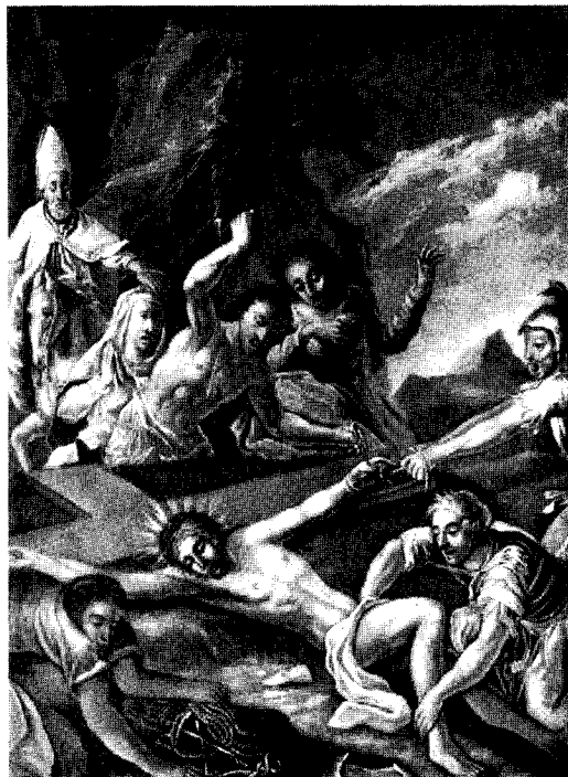
Abb. 14. St. Georgen, dzt. Wels, Museum

Kreuzwege der Heindl-Werkstatt XI. Station: Kreuzannagelung