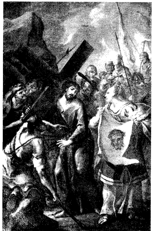
Abb. 8. St. Georgen, dzt. Wels, Museum