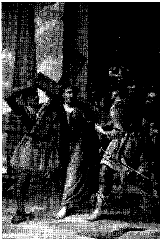
Abb. 1. Hofkirchen a. d. T.