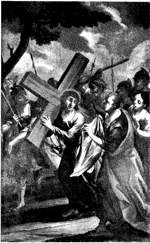
Abb. 5. Hofkirchen a. d. T. Kreuzwege der Heindl-Werkstatt VI. Station: Veronica reicht das Schweißstuch