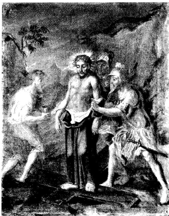
Abb. 11. St. Georgen, dzt. Wels, Museum