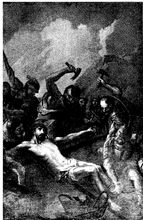
Abb. 15. Wimsbach

Kreuzwege der Heindl-Werkstatt XI. Station: Kreuzannagelung