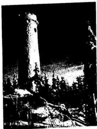
Warte auf dem Sternstein (1125 m)

Für d' Weibslaut blüah'n Bleamàn Rundum nettà gnuà, Nöt z' hoch und nöt z' toif, Du kimmst überall dazua, Und Schwämmerl, ja mein! Wia d' Stoaà so vü(!), Dö findt mà ganze Hauffn Dort, wann mà nur wü(!) — Und dö Börstaudn sänd reich, Ja, dàß sie 's kàm tragn; Da hast 's Bitscherl voll bal(d), Und du brauchst dih nöt z' plag'n.