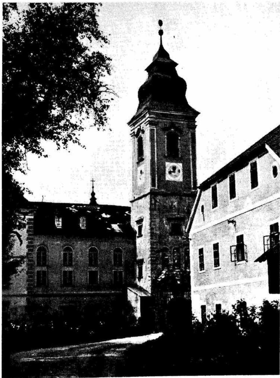
Baumgartenberg, das Herz des Machlandes, 1141 als Zisterzienserstift von Otto v. Machland und seiner Gemahlin Jutta gegründet.