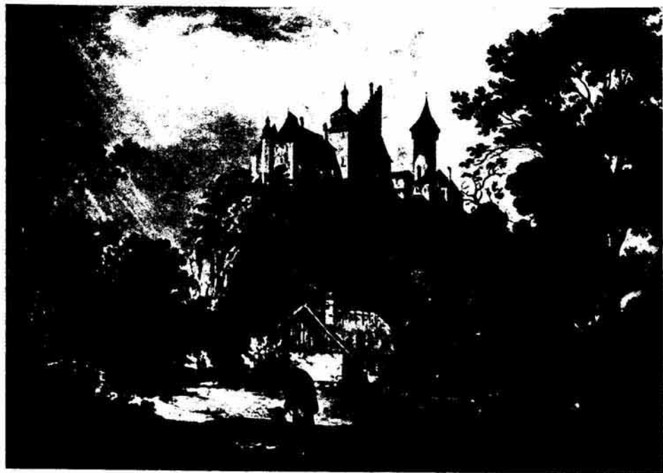
Schloß Klam bei Grein (nach einem Aquarell von Ernst Walker)

„Hast Du bemerkt, daß man eigentlich nie-