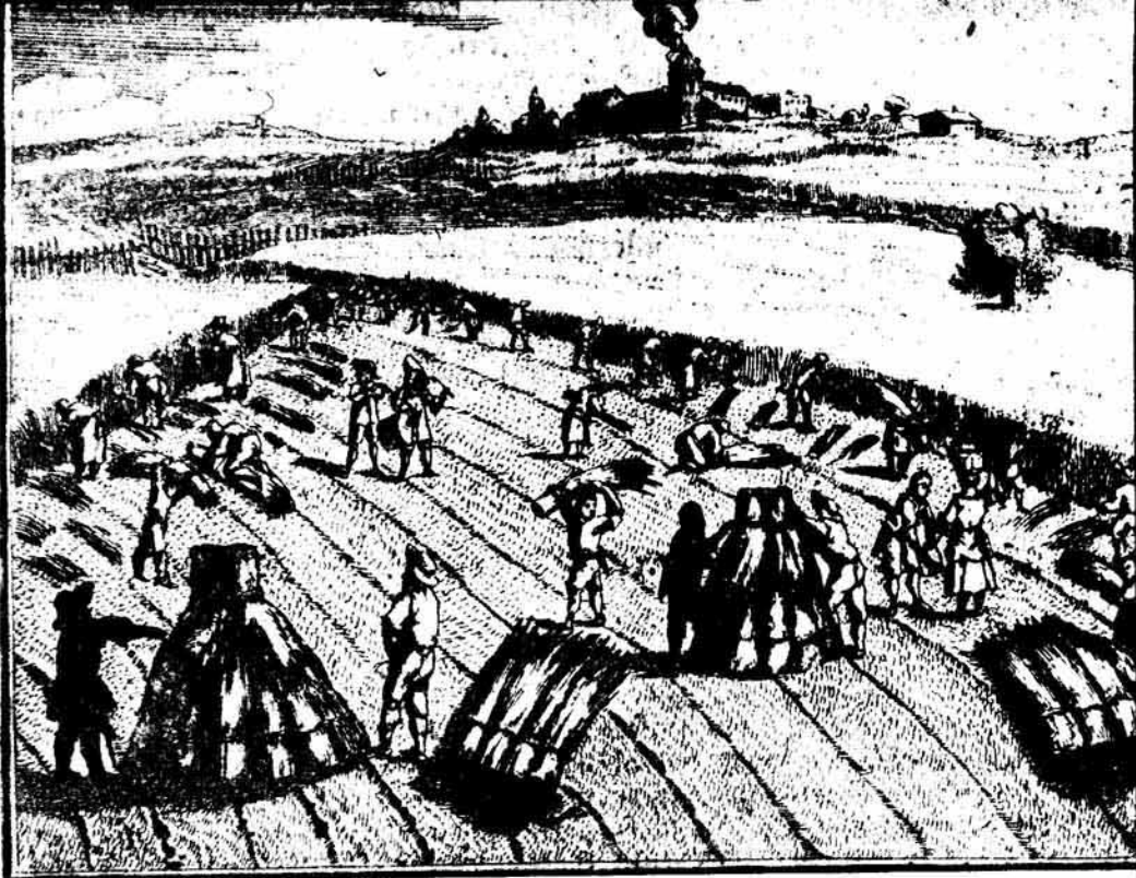
Getreideernte mit Musikbegleitung (1682)