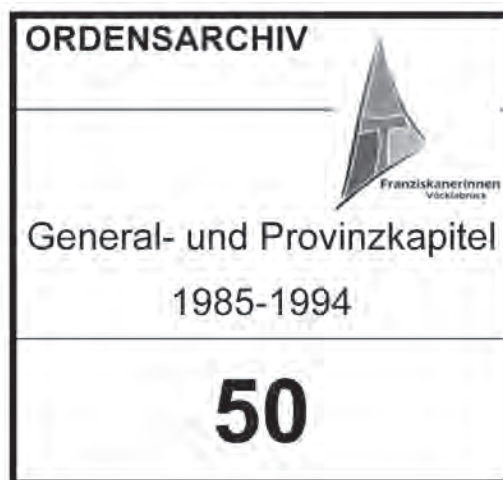
Abb. 2: Etikette an einem Archivkarton im OAFrVö

Die Archivkartons und Handschriften wurden mit Etiketten versehen, welche große, gut lesbare fortlaufende Nummern sowie etwas kleiner geschriebene Schlagworte, den Inhalt betreffend (und natürlich auch das Ordenslogo) aufweisen.