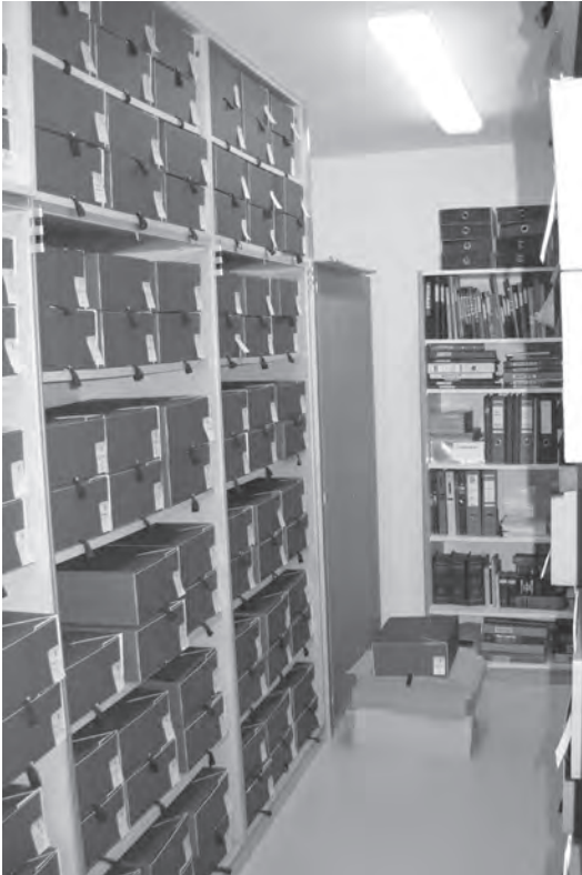
Abb. 3: Blick ins Ordensarchiv der Franziskanerinnen von Vöcklabruck während der Neuordnung (Dezember 2011)

Weiters birgt das Ordensarchiv der Franziskanerinnen von Vöcklabruck eine Reihe von Verwaltungshandschriften, Kopierbücher (gebundene Abschriften wichtiger Korrespondenz) sowie handschriftliche Aufzeichnungen religiösen und klösterlichen Inhaltes verschiedenster Art.